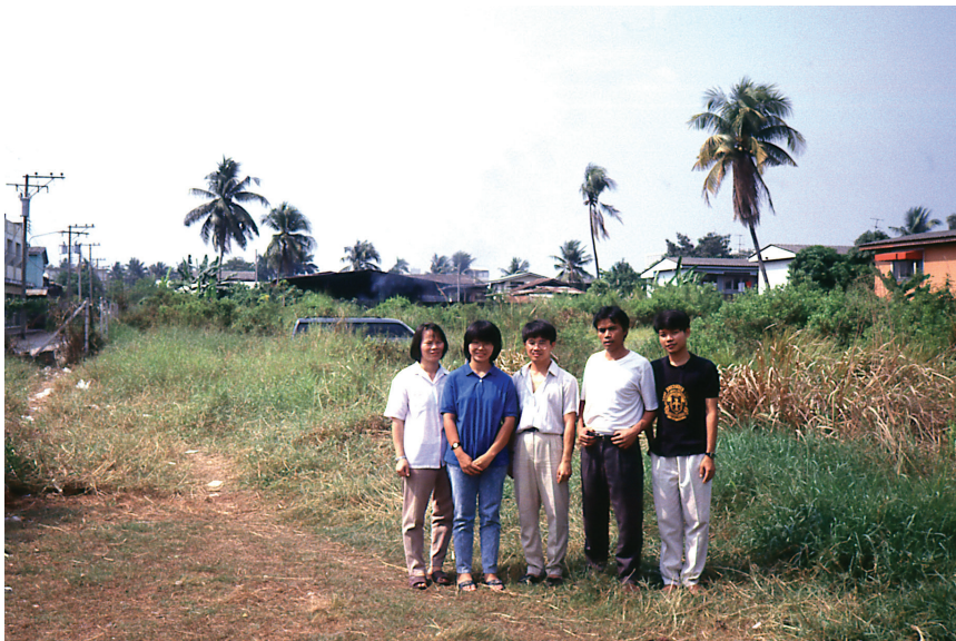
นักศึกษาพระคริสตธรรมรุ่นแรก

การเตรียมการสำหรับการฝึกอบรมผู้ร่วมงานในมิชชันลู่เธอร์แรนฯ เริ่มขึ้นในปี ค.ศ. 1981 ค่อนข้างง่ายที่จะหาผู้ร่วมงานใหม่สำหรับการขยายงานของมิชชันลู่เธอร์แรนฯ ผู้ร่วมงานใหม่เหล่านี้มาจากภูมิหลังที่แตกต่างกัน จำนวนผู้เรียนที่สถาบันศาสนศาสตร์ในประเทศไทยเพิ่มขึ้นอย่างรวดเร็วในช่วงทศวรรษ 1980 หลังจากสำเร็จการศึกษา พวกเขาต้องการสถานที่เพื่อรับใช้และคริสตจักรท้องถิ่นที่เขาจากมาก็ไม่สามารถรองรับได้ กลุ่มสำคัญคือผู้สำเร็จการศึกษาจากพระคริสตธรรมกรุงเทพ ซึ่งมาจากคริสตจักรของสภาคริสตจักรในประเทศไทย (CCT) ในเขตภาคเหนือ คณะโปรเตสแตนต์ในประเทศไทยได้รับอิทธิพลจากทั้งคณะเพรสไบทีเรียน คริสตจักรปฏิรูป และความเชื่อแบบอนาแบพติสต์ และนักปฏิรูปหัวรุนแรงคนอื่นๆ กลุ่มแบปติสต์ เพ็นเทคอสต์ และกลุ่มอิวานเจลิคอลต่างๆ มีส่วนสำคัญที่คล้ายคลึงกันกับกลุ่มปฏิรูปหัวรุนแรง ในช่วงปีแรกๆ ของพันธกิจ มิชชันนารีและผู้ร่วมงานชาวไทยของมิชชันลู่เธอร์แรนฯ บางคนรู้สึกว่าการใช้ชีวิตที่บริสุทธิ์ของคริสเตียนถูกเน้นย้ำมากเกินไปในคริสตจักรไทย พวกเขา รู้สึก