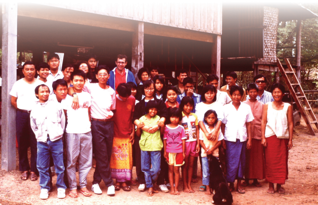
การขยายคริสตจักรไปสู่ต่างจังหวัด

ในช่วงปีแรกๆ ของมิชชันลูเธอรันฯ สถานที่ที่เพิ่งเปิดใหม่ถูกเรียกว่า คริสตจักร ในธรรมนูญของสภาคริสตจักรลูเธอรันฯ ปี ค.ศ. 1994 คริสตจักร ท้องถิ่นถูกแบ่งออกเป็นคริสตจักรและสถานประกาศ ตามข้อบังคับได้กำหนดให้ มีการจดทะเบียนตั้งเป็นคริสตจักร ส่วนสถานประกาศอาจจะอยู่ในความดูแล ของคริสตจักรแม่ หรือจดทะเบียนโดยตรงภายใต้สภาคริสตจักรลูเธอรันฯ นับแต่เริ่มต้นพันธกิจมิชชันลูเธอรันฯ เป็นที่แน่ชัดแล้วว่าทุกคริสตจักรจำเป็นต้องเลี้ยงตัวเอง เริ่มมีการถวายทรัพย์เป็นประจำและมีการสอนการทำบัญชีและการบริหารจัดการการเงิน แผนการการเลี้ยงตนเองได้รับการยอมรับจากสมาชิก ใหญ่ของมิชชันลูเธอรันฯ ในปี ค.ศ. 1987 แนวคิดหลักคือทุกคริสตจักรควรเพิ่มรายได้ภายในท้องถิ่นเพื่อให้พวกเขาสามารถเลี้ยงตัวเองได้ภายใน 18 ปี เงินเดือนของผู้รับใช้จะจ่ายโดยกองทุนกลางของมิชชันลูเธอรันฯ โดยมีเป้าหมายคือให้ทุกคริสตจักรส่งรายได้ส่วนหนึ่งไปยังกองทุนกลาง นอกจากนี้ทุกคริสตจักร ต้องพยายามที่จะรับผิดชอบค่าใช้จ่ายของตัวเอง 10 เปอร์เซ็นต์ของราคา