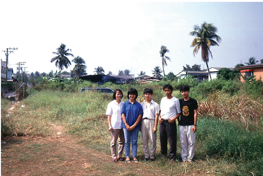
ภาพนักศึกษาพระคริสตธรรมลูเธอรันกลุ่มแรก ยืนบนที่ดินเปล่าก่อนที่จะมีอาคารสำนักงาน สสท.

มากขึ้น มีมิชชันนารีลูเธอรันฯ ตัดสินใจใช้หนังสือเพลงนมัสการเหล่านั้นในที่ประชุม นอกจากหนังสือเพลงนมัสการแล้วองค์กรต่างๆ ยังได้จัดพิมพ์เพลงสั้นที่ใช้ร้อง ในการเตรียมใจก่อนการนมัสการ นอกจากนี้ องค์กรโอเวอร์ซีมิชชันนารีเฟลโลชิพ (Overseas Missionary Fellowship - OMF) ยังได้จัดพิมพ์หนังสือเพลงเล่ม เล็กที่มีเนื้อร้องและทำนองแบบไทยเดิม ซึ่งทางมิชชันนารีลูเธอรันฯ เองมีความ หวังว่าสักวันหนึ่งคริสตจักรลูเธอรันจะมีหนังสือเพลงนมัสการเป็นของตัวเอง จนกระทั่งในปี ค.ศ. 1998 คณะกรรมการบริหารสภาคริสตจักรลูเธอรันฯ ได้ แต่งตั้งคณะกรรมการเพื่อเตรียมสำหรับการจัดทำหนังสือเพลงนมัสการขึ้น ความหวังนั้นได้สำเร็จเป็นจริงในปี ค.ศ. 2008 สภาคริสตจักรลูเธอรันใน ประเทศไทยได้จัดพิมพ์หนังสือเพลงนมัสการขึ้นโดยใช้ชื่อว่า “เพลงแห่งพระคุณ” มีเพลงนมัสการจำนวน 313 บทเพลง โดยมีประมาณ 40 บทเพลงที่ผู้แต่งและ เรียบเรียงเป็นสมาชิกของสภาคริสตจักรลูเธอรันฯ