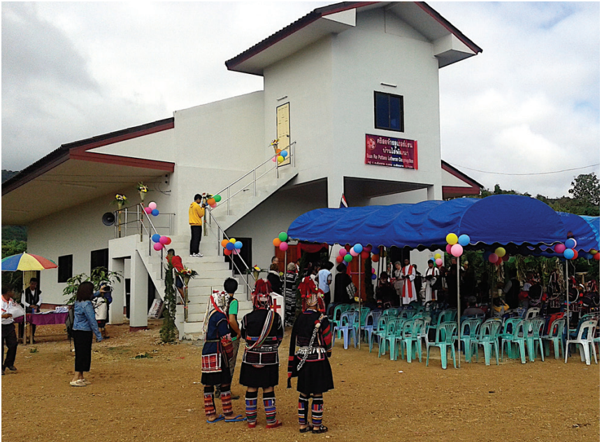
กลุ่มพี่น้องอาข่า จ.เชียงราย

เชียงราย จัดทะเบียนในปี ค.ศ. 2002 ตามด้วยคริสตจักรบ้านไร่พัฒนาในอำเภอแม่ลาวในปี ค.ศ. 2010 ในทศวรรษ 2010 ได้มีคริสตจักรหลายแห่ง และคริสเตียนหลายกลุ่ม (สถานประกาศ) ของชนเผ่าลาหู่และอาข่าเข้าร่วมในสภาคริสตจักรลูเธอร์แรนฯ ประกอบไปด้วยคริสตจักรบ้านใหม่ห้วยหลวงท่าฮ่อลูเธอร์แรน คริสตจักรบ้านใหม่แม่ยางมันอาข่าลูเธอร์แรน คริสตจักรบ้านใหม่เจริญลูเธอร์แรน (อาข่า) และคริสตจักรบ้านใหม่สิริพัฒนาลูเธอร์แรน ในปี ค.ศ. 2019 เขตนี้มีสถานประกาศหกแห่ง ได้แก่ สถานประกาศทรายทองลาหู่ลูเธอร์แรน สถานประกาศลูเธอร์แรนบ้านใหม่สันติสุขลาหู่เวียงป่าเปา ศูนย์แรงงานพม่า กลุ่มคริสเตียนแม่ตาแมวในอำเภอแม่สรวย และสถานประกาศบ้านโพธิ์ลูเธอร์แรน (ลาหู่) ในจังหวัดเชียงใหม่ สมาคมมิชชั่นลูเธอร์แรนแห่งฟินแลนด์ (FELM) ได้สนับสนุนโครงการแยกต่างหากในการแปลพระคัมภีร์เป็นภาษาอาข่า