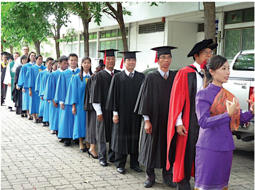
พิธีจบหลักสูตรของนักศึกษา

หลักสูตรสร้างสาวก จัดขึ้นแก่สมาชิกคริสตจักรที่เข้มแข็ง เพื่อเตรียมพวกเขาให้เป็นพยานและมีส่วนรับผิดชอบในคริสตจักร ในช่วงทศวรรษ 1980 ได้มีการจัดอบรมบางส่วนในคริสตจักรท้องถิ่นและบางส่วนได้ร่วมเรียนกับนักศึกษาเต็มเวลา ในความเป็นจริงหลักสูตรดังกล่าวสามารถใช้ได้ตลอดเวลาโดยร่วมมือกับคริสตจักรท้องถิ่น แต่การนำไปใช้อย่างเหมาะสมนั้นเป็นเรื่องยาก หลักสูตร