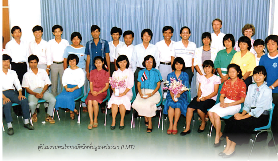
ผู้ร่วมงานคนไทยสมัยมิชชันลูเธอร์แรนฯ (LMT)

ความพยายามที่จะเขียนธรรมนูญสำหรับสภาคริสตจักรลูเธอร์แรนฯ ในอนาคตยังคงดำเนินต่อไปเป็นเวลาหลายปี ในขั้นตอนแรกสมัชชาใหญ่ของมิชชันลูเธอร์แรนในประเทศไทยยอมรับแนวทางการปฏิบัติงานสำหรับคณะลูเธอร์แรนไทยซึ่งประกอบไปด้วยสมาชิกและผู้ร่วมงานในปี ค.ศ. 1983 ซึ่งแนวทางการปฏิบัติ