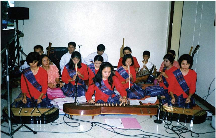
การใช้ดนตรีไทยในการนมัสการ

หลังจากนั้นได้มีการปรับโครงสร้างขององค์กรใหม่ การศึกษาในหลักสูตรพันธกิจคริสตจักรและประกาศนียบัตรและหลักสูตรลูเธอรันศึกษาได้เปิดสอนเป็นหลักสูตรเร่งรัด หลักสูตรลูเธอรันศึกษานี้จัดทำขึ้นสำหรับผู้ประกาศที่