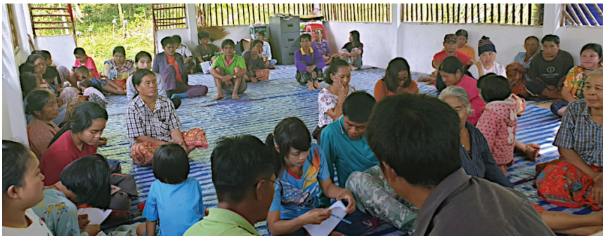
กลุ่มที่น้องลัวะ จ.น่าน

คริสตจักรลูเธอรันบ้านนาโป่งและคริสตจักรลูเธอรันบ้านเด่น เป็นคริสตจักรกลุ่มแรกในอำเภอเกลือ จังหวัดน่าน ได้รับการจดทะเบียนในปี ค.ศ. 2005 ผู้ร่วมงานของสภาคริสตจักรลูเธอรันฯ ได้มีการติดต่อกับคนในพื้นที่ดังกล่าวเมื่อหลายปีก่อน คริสตจักรลูเธอรันห้วยหมี่และคริสตจักรลูเธอรันบ้านห้วยโตน จดทะเบียนในปี ค.ศ. 2010 ในปี ค.ศ. 2019 เขตที่ 5 มีสถานประกาศสี่แห่ง ได้แก่ จุดประกาศลูเธอรันบ้านป่าก่อ จุดประกาศลูเธอรันสวนยาง สถานประกาศลูเธอรันบ้านห้วยโป่ง และสถานประกาศลูเธอรันบ้านก่อกวาง มีสมาชิกทั้งหมดประมาณ 1,400 คน ในบางพื้นที่เกือบทั้งหมดกลายเป็นคริสเตียน สมาชิกส่วนใหญ่อยู่ในกลุ่มชาติพันธุ์ลัวะซึ่งยังไม่มีภาษาวรรณกรรม มีความพยายามอย่างต่อเนื่องในการพัฒนารูปแบบการเขียนของลัวะและได้ดำเนินการขั้นตอนแรกในการแปลพระคัมภีร์ การขยายตัวเป็นไปอย่างรวดเร็วและมีความจำเป็นในการฝึกอบรมผู้นำท้องถิ่นสำหรับคริสตจักรที่กำลังเติบโต การศึกษาหลักสูตรพันธกิจคริสตจักรดำเนินการโดยพระคริสตธรรมลูเธอรันฯ ระหว่างปี ค.ศ. 2016-2018 เป็นเสมือนหลักสูตรระยะสั้นสำหรับผู้หน้าที่เป็นอาสาสมัครหรือผู้นำฆราวาส ผู้ที่จบหลักสูตรเหล่านี้บางคนกำลังศึกษาต่อในระดับประกาศนียบัตรศาสนศาสตร์ร่วมกับนักศึกษาจากเขตอื่นๆ ได้มีโครงการการเลี้ยงตนเอง ด้านการเกษตรเรียกว่า Farming Project เป็นการทดลองขนาดเล็กในเขตของบ้านเด่น