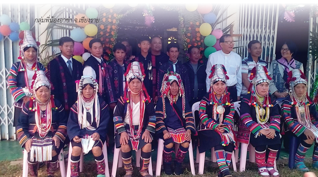
กลุ่มพี่น้องอาซา จ.เชียงราย

ตามแผนห้าปี ค.ศ. 1996-2000 ของสภาคริสตจักรลูเธอร์แรนในประเทศไทย พันธกิจของสภาคริสตจักรลูเธอร์แรนฯ จะขยายไปยังภาคเหนือของประเทศไทย ได้มีการสำรวจในพื้นที่จังหวัดเชียงรายและพยายามเปิดคริสตจักรตามสถานที่ต่างๆ คริสตจักรป่าลั่นลูเธอร์แรน อำเภอต๋อยหลวง จังหวัด