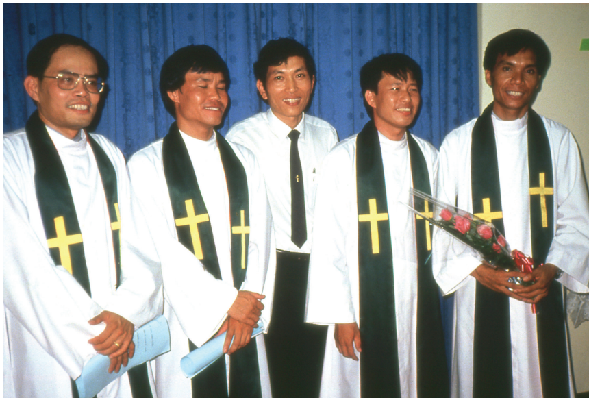
การสถาปนาศาสนาจารย์ของมิชชันลูเธอร์แรนฯ (LMT)

ความพยายามที่จะเขียนธรรมนูญสำหรับสภาคริสตจักรลูเธอร์แรนฯ ในอนาคตยังคงดำเนินต่อไปเป็นเวลาหลายปี ในขั้นตอนแรกสมัชชาใหญ่ของมิชชันลูเธอร์แรนในประเทศไทยยอมรับแนวทางการปฏิบัติงานสำหรับคณะลูเธอร์แรนไทยซึ่งประกอบไปด้วยสมาชิกและผู้ร่วมงานในปี ค.ศ. 1983 ซึ่งแนวทางการปฏิบัติ