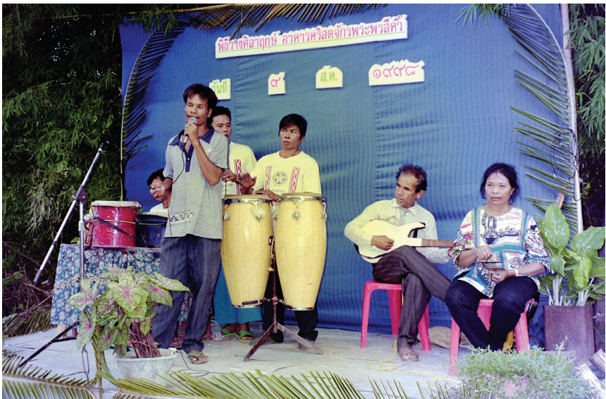
การเริ่มต้นคริสตจักรพระพรสีคิ้ว

คริสตจักรพระพรสีคิ้วลูเธอรัน ซึ่งอยู่ในจังหวัดนครราชสีมา (โคราช) เกิดขึ้นจากการเป็นพยานของคริสเตียนใหม่ สมาชิกกลุ่มแรกที่รับบัพติศมาในปี ค.ศ. 1986 ในคริสตจักรกล้วยน้ำไทย (คริสตจักรอิมมานูเอล) แต่ไม่ได้จดทะเบียนเป็นคริสตจักรจนกระทั่งปี ค.ศ. 1991 คริสเตียนใหม่รวมตัวกันที่บ้านตัวเองในหมู่บ้านแห่งหนึ่งที่ อ.สีคิ้ว ทีมงานจากผู้ร่วมงานสถาบันศาสนศาสตร์ลูเธอรันและมิชชันนารีลูเธอรันฯ จากอุบลราชธานีและกรุงเทพฯ ได้ช่วยดูแลคริสเตียนใหม่จนกระทั่งได้มีการจดทะเบียนเป็นคริสตจักร ในปี ค.ศ. 1991 มีการเช่าบ้านสำหรับการนมัสการในอำเภอสีคิ้ว ผ่านไปไม่นานบ้านที่เช่าก็ถือว่ามีขนาดเล็กเกินไปสำหรับงานที่กำลังเติบโตขึ้น และในปี ค.ศ. 1997 ได้มีการซื้อที่ดินแห่งหนึ่งในเขตชานเมืองของอำเภอสีคิ้ว สมาชิกได้สร้างอาคารไม้ไผ่ขึ้นใช้ชั่วคราว ในปีถัดมา ค.ศ. 1998 ได้มีการวางศิลาฤกษ์เพื่อสร้างอาคารคริสตจักร