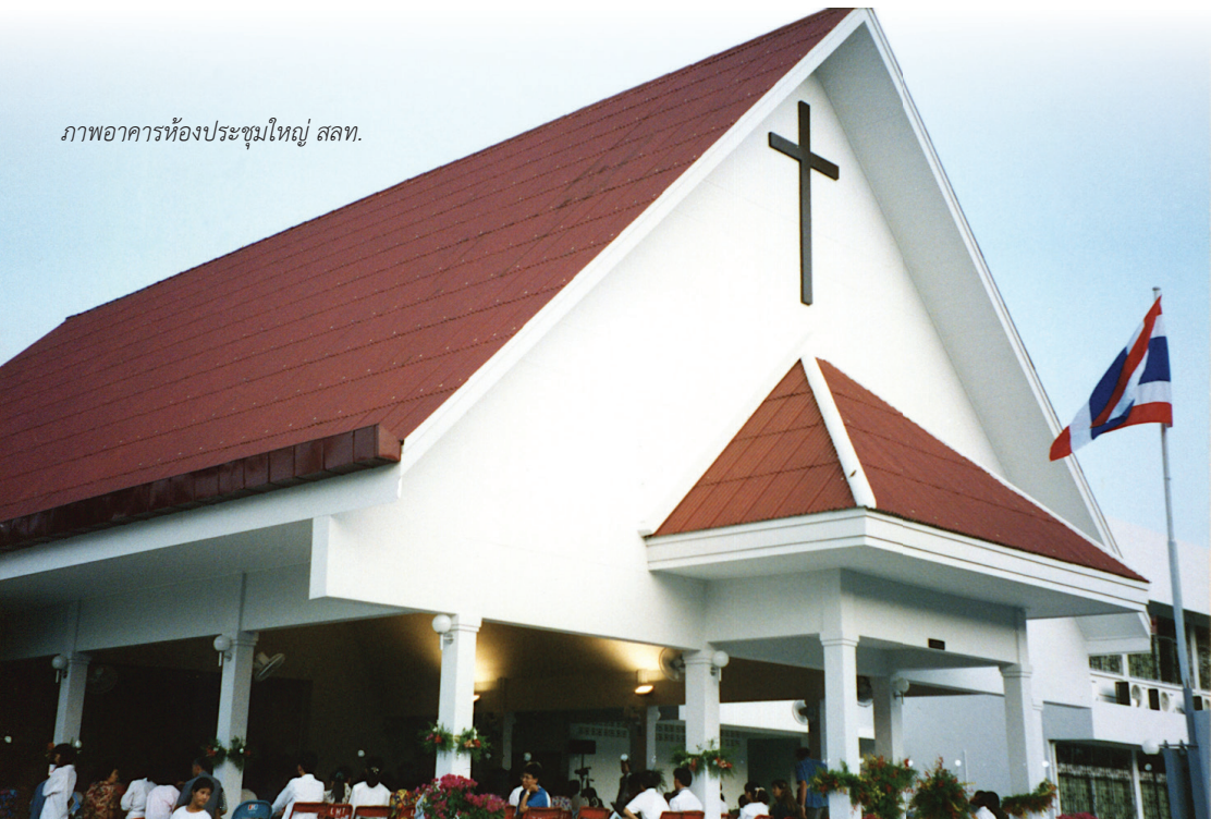
ภาพอาคารห้องประชุมใหญ่ สทท.

สภาคริสตจักรลูเธอร์แรนในประเทศไทยก่อตั้งขึ้นในวันที่ 24 เมษายน ค.ศ. 1994 ซึ่งเป็นการประชุมสมัชชาใหญ่ครั้งแรก ตามที่สมัชชาลูเธอร์แรนไทยและองค์กรสมาชิกของมิชชันลูเธอร์แรนในประเทศไทย (LMT) ได้อนุมัติธรรมนูญที่ใช้สำหรับสภาคริสตจักรลูเธอร์แรนในประเทศไทย (ELCT) มาก่อนหน้านั้น ข้อตกลงความร่วมมือระหว่างสภาคริสตจักรลูเธอร์แรนฯ และมิชชันลูเธอร์แรนฯ ได้รับลงนามโดยเป็นส่วนหนึ่งของกระบวนการพิจารณาในที่ประชุมสมัชชาใหญ่ โดยที่มิชชันลูเธอร์แรนฯ ยังคงเป็นองค์กรเช่นเดิมแต่ลดรูปแบบการบริหารลง เมื่อกล่าวถึงข้อตกลงเกี่ยวกับผู้แทนท้องถิ่นของมิชชันลูเธอร์แรนฯ ที่ได้เข้าร่วมการประชุมของสภาคริสตจักรลูเธอร์แรนฯ และสมัชชาใหญ่นั้น ในช่วงเปลี่ยนผ่านบางปี ตัวแทนมีสิทธิในการออกเสียงในจำนวนจำกัด แต่ภายหลังได้มีการทบทวนข้อตกลงใหม่และภาคีต่างๆ สามารถเจรจาอย่างเป็นอิสระกับ