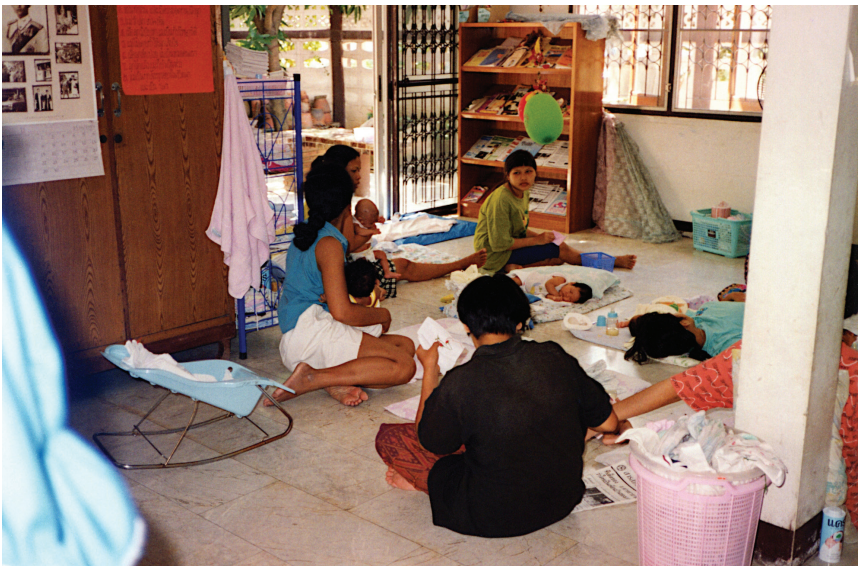
พันธกิจบ้านพระคุณ ภายใต้แผนกคริสเตียนสงเคราะห์

ตามความตกลงว่าด้วยความร่วมมือด้านพันธกิจในประเทศไทย คริสเตียนบริการเป็นส่วนสำคัญของพันธกิจของมิชชันลู่เธอร์แรนฯ ตั้งแต่เริ่มต้นและสภาคริสตจักรลูเธอร์แรนฯ จะยังดำเนินการต่อไปในประเทศไทย งานคริสเตียนสังคมสงเคราะห์มักกระทำผ่านทางมูลนิธิและองค์กรการกุศลต่างๆ ที่แยกจากคริสตจักรในท้องถิ่น โรงเรียน โรงพยาบาล และสถาบันทางสังคม ต้องการเงินทุนจำนวนมากและส่วนมากได้รับการสนับสนุนทางการเงินจากต่างประเทศ นอกจากนี้หน่วยงานเหล่านี้ยังต้องการบุคลากรจำนวนมากเพื่อดำเนินการอย่างไรก็ตามในหลายกรณี โรงเรียนและโรงพยาบาลได้พึ่งพาตนเองหรือแม้แต่แหล่งรายได้ในช่วงการเริ่มต้น มิชชันลู่เธอร์แรนฯ ไม่ได้ตั้งใจที่จะจัดตั้งสถาบันขนาดใหญ่เพราะเกรงว่าสิ่งเหล่านี้จะกลายเป็นภาระต่อสภาคริสตจักรลูเธอร์แรนฯ ในอนาคต สภาคริสตจักรลูเธอร์แรนฯ ที่ประกอบด้วยคริสตจักรท้องถิ่นเล็กๆ จะไม่สามารถรับผิดชอบงานขนาดใหญ่ได้ เราเพียงเน้นการพัฒนารูปแบบความรักและการรับใช้ของคริสเตียน ซึ่งสามารถเกิดขึ้นในบริบทของคริสตจักรท้องถิ่นได้