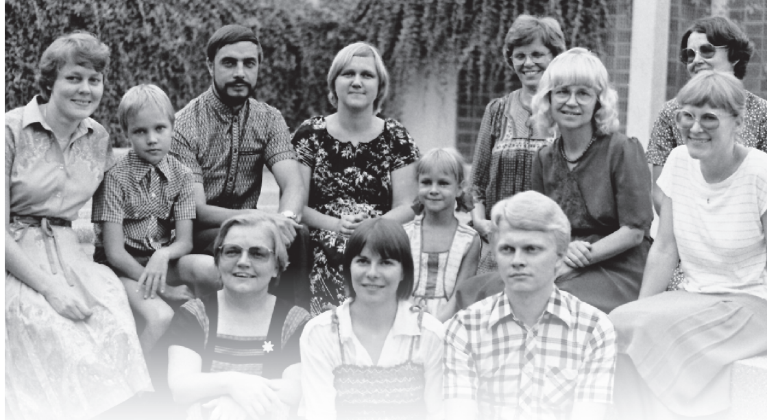
ภาพด้านบน มิชชันนารีลูเธอรันแห่งฟินแลนด์

การประชุมใหญ่สามัญประจำปีครั้งแรกของมิชชันนารีลูเธอรันในประเทศไทย มีขึ้นในเดือนกันยายน ค.ศ. 1980 โดยมีมิชชันนารีสิบเอ็ดคนเข้าร่วม หลังจากนั้นจำนวนมิชชันนารีเพิ่มขึ้นอย่างรวดเร็ว หน่วยงานรัฐบาลออกโควตาสำหรับบิชอปและใบอนุญาตทำงานสำหรับมิชชันนารีจำนวน 28 คน ในทศวรรษ 1980 สมาคมมิชชันนารีแห่งนอร์เวย์และสมาคมมิชชันนารีลูเธอรันแห่งฟินแลนด์ได้แบ่งสัดส่วนใบอนุญาตอย่างเท่าเทียมกัน ส่งผลให้มีความคล่องตัวในการทำงานมากขึ้น ภายในปี ค.ศ. 1995 มีมิชชันนารีมากถึง 79 คน ที่เข้ามารับใช้ในประเทศไทย มีหลายคนที่ใช้เพียงวาระเดียว อย่างไรก็ตาม มีมิชชันนารีจำนวน 13 คนที่เดินทางมายังประเทศไทยก่อนปี ค.ศ. 1983 และยังคงร่วมรับใช้ในพันธกิจกับสภาคริสตจักรลูเธอรันฯ หลังปี ค.ศ. 1994 ถัดมาอีกหลายปี จำนวนมิชชันนารีเริ่มลดจำนวนลง โดยพบว่าตามปฏิทินประจำปีของสภาคริสตจักรลูเธอรันฯ ในปี ค.ศ. 2019 มีมิชชันนารีเหลือเพียง 16 คนเท่านั้นที่ยังคงรับใช้อยู่ คือส่วนของสมาคมมิชชันนารีแห่งนอร์เวย์มีมิชชันนารีเหลือเพียงคนเดียว และมิชชันนารีของสมาคมมิชชันนารีลูเธอรันแห่งฟินแลนด์มี 8 คน แต่หลายคนมีหน้าที่ในประเทศอื่นๆ ในภูมิภาคนี้ด้วย สภาคริสตจักรลูเธอรันฮ่องกง (ELCHK) มีมิชชันนารี 2 คน สภาคริสตจักรลูเธอรันในสิงคโปร์มี 3 คน และสภาคริสตจักรลูเธอรันมาลากัสซีมี 2 ครอบครัว