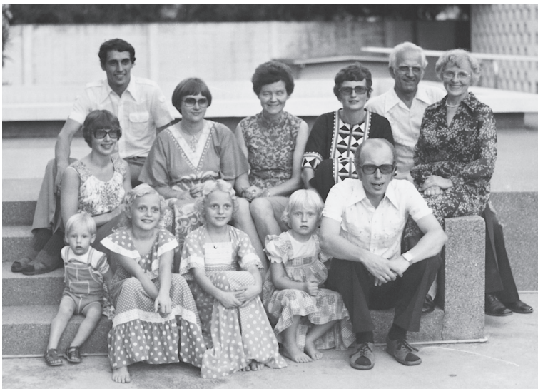
ภาพด้านบน มิชชั่นนารีลูเธอร์แรนแห่งนอร์เวย์

ในปี ค.ศ. 1980 ได้มีการลงนามข้อตกลงเพื่อจัดตั้งองค์กรร่วมที่เรียกว่า มิชชั่นลูเธอร์แรนแห่งประเทศไทย Lutheran Mission in Thailand (LMT) การร่วมก่อตั้งองค์กรนี้เพื่อหลีกเลี่ยงปัญหาที่เกิดขึ้นในหลายประเทศ ซึ่งแต่ละองค์กรต่างมุ่งสร้างงานของตนแบบต่างคนต่างทำซึ่งเป็นเหตุให้มีคริสตจักรลูเธอร์แรนขนาดเล็กหลายแห่งเกิดขึ้น ในปี ค.ศ. 1979 สมาพันธ์ลูเธอร์แรนโลกได้จัดให้มีการประชุมเพื่อปรึกษาหารือเกี่ยวกับความร่วมมือด้านพันธกิจสำหรับผู้นำคริสตจักรลูเธอร์แรนแห่งเอเชียขึ้นที่กรุงมะนิลา ประเทศฟิลิปปินส์ ในการประชุมนี้ได้ส่งผลต่อการทำข้อตกลงว่าด้วยความร่วมมือด้านพันธกิจในประเทศไทย ซึ่งเป็นพื้นฐานของพันธกิจของมิชชั่นลูเธอร์แรน คณะกรรมการบริหารร่วมเพื่อประเทศไทยได้จัดให้มีการร่วมมือกันขึ้นระหว่างผู้นำองค์กรภาคีต่างๆ ของมิชชั่นลูเธอร์แรนในประเทศไทย ประกอบด้วย ผู้แทนจากนอร์เวย์ ฟินแลนด์ และฮ่องกง