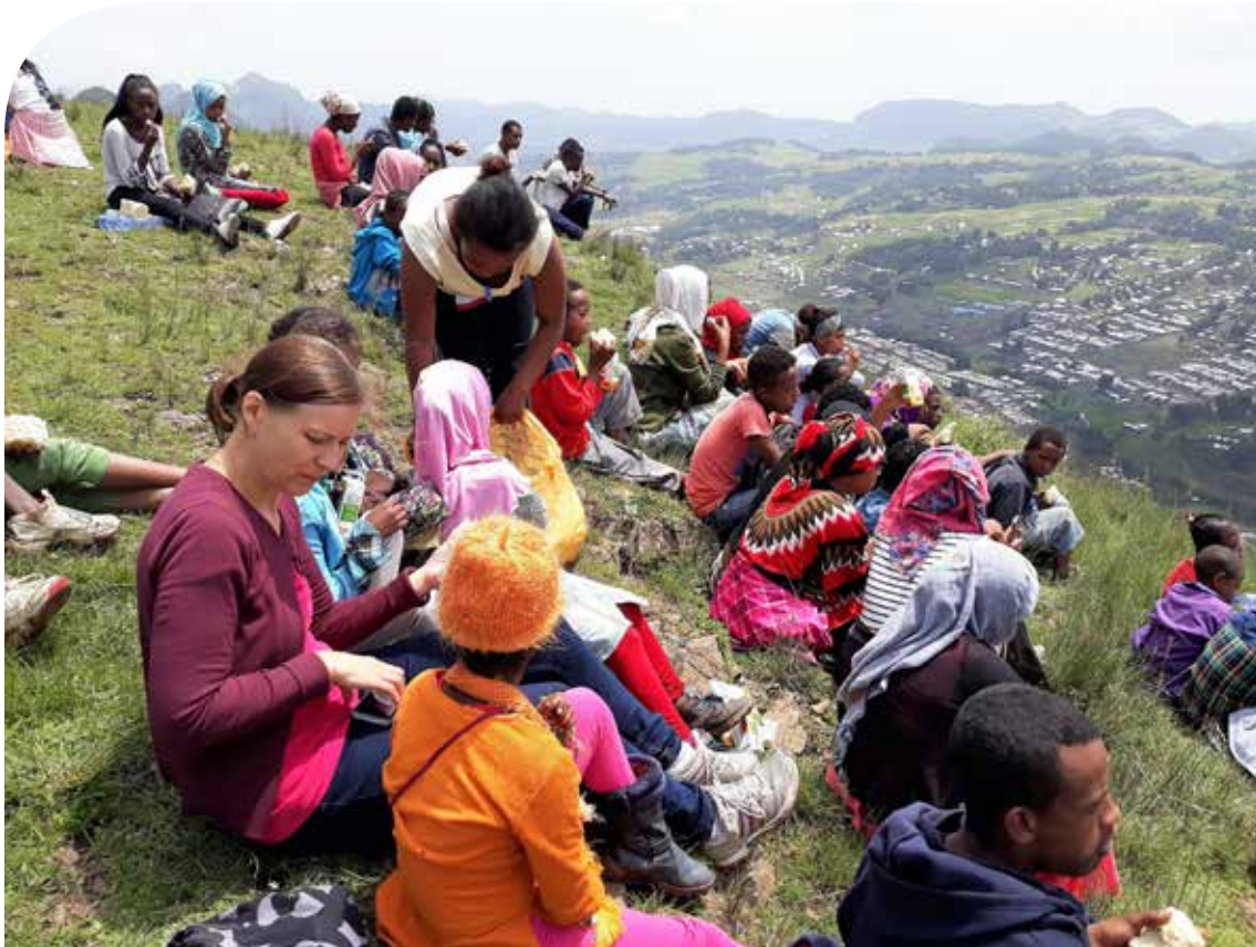
2. Tosa Mountain, Kari Pentikäinen 2018