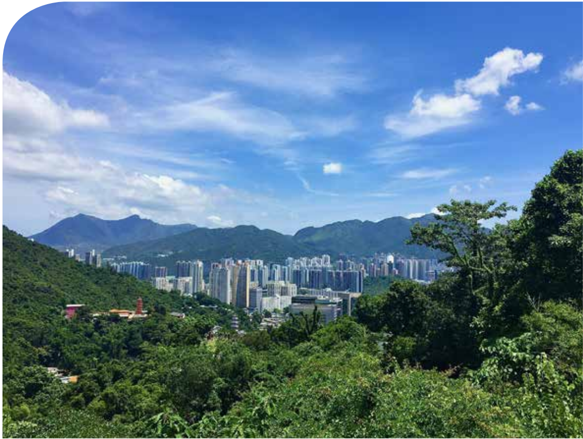
2. Maisema teologisen seminaarin pihalta HK, Harri Koskela 2022