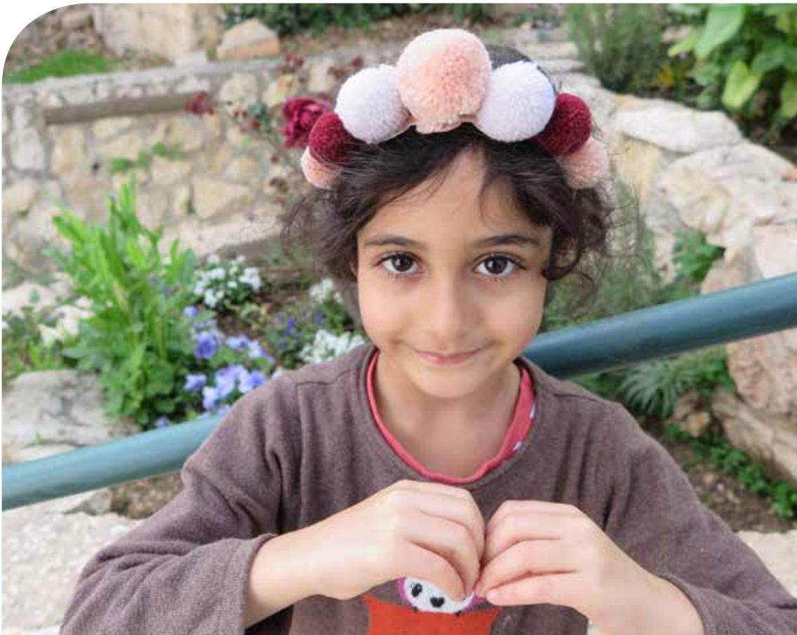
1. Felm-keskus Jerusalem, Sari Lehtelä 2018