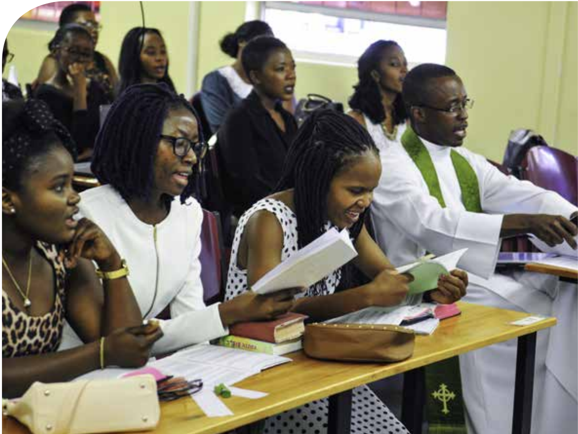
2. Namibia, Opiskelijoita jumalanpalveluksessa, Päivi Repo 2017