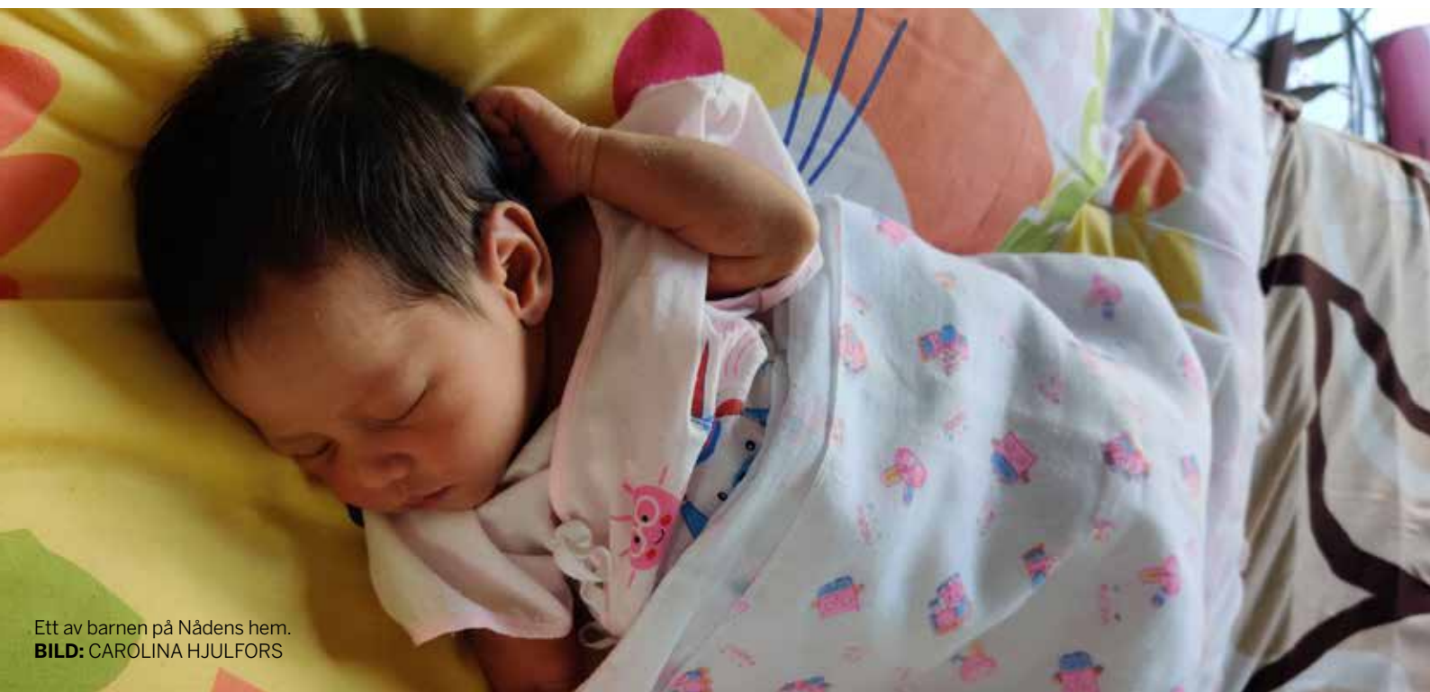
Ett av barnen på Nådens hem.

Jag vill avsluta med en hälsning från arbetarna vid Nådens hem: ”Vi vill tacka finländarna för allt stöd vi har fått och för att ni förstår hur viktigt arbetet som vi gör är.”