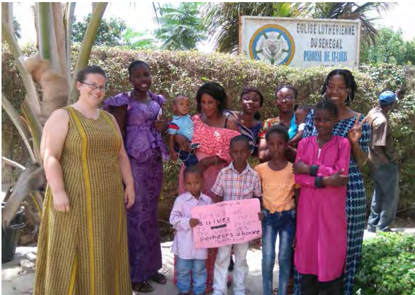
"Kom och följ mig. Jag skall göra er till människofiskare..." (Matt 4:19) är bibelstället som barnen har fått lära sig.