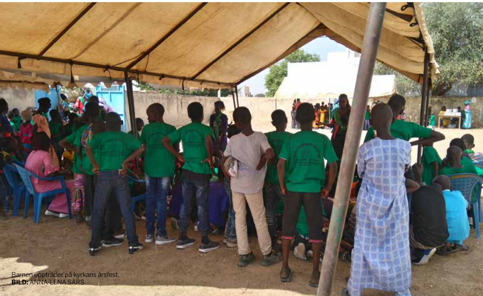
Barnen uppträder på kyrkans årsfest.