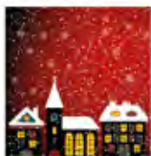
Jul i byn