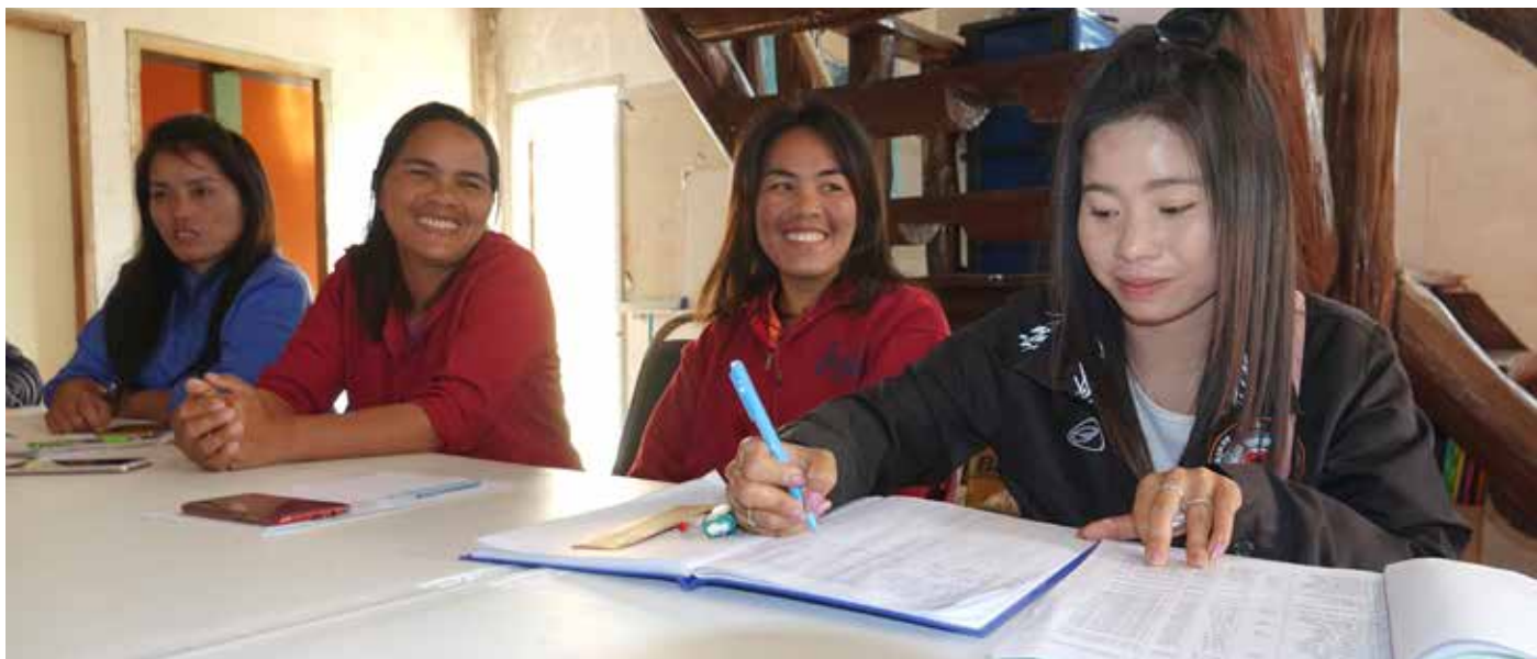
Evangelisterna Päng, Phim, Bua och Dau arbetar i provinsen Nan.

1950–1960-talet. Till Nan provinsen där- emot kom folket redan innan thaifolket. Lua är alltså ett urfolk.”