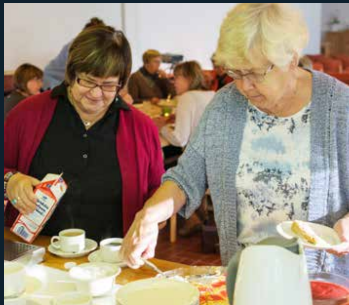
Ett tjugotal kvinnor samlades kring brunchbordet i Bennäs.