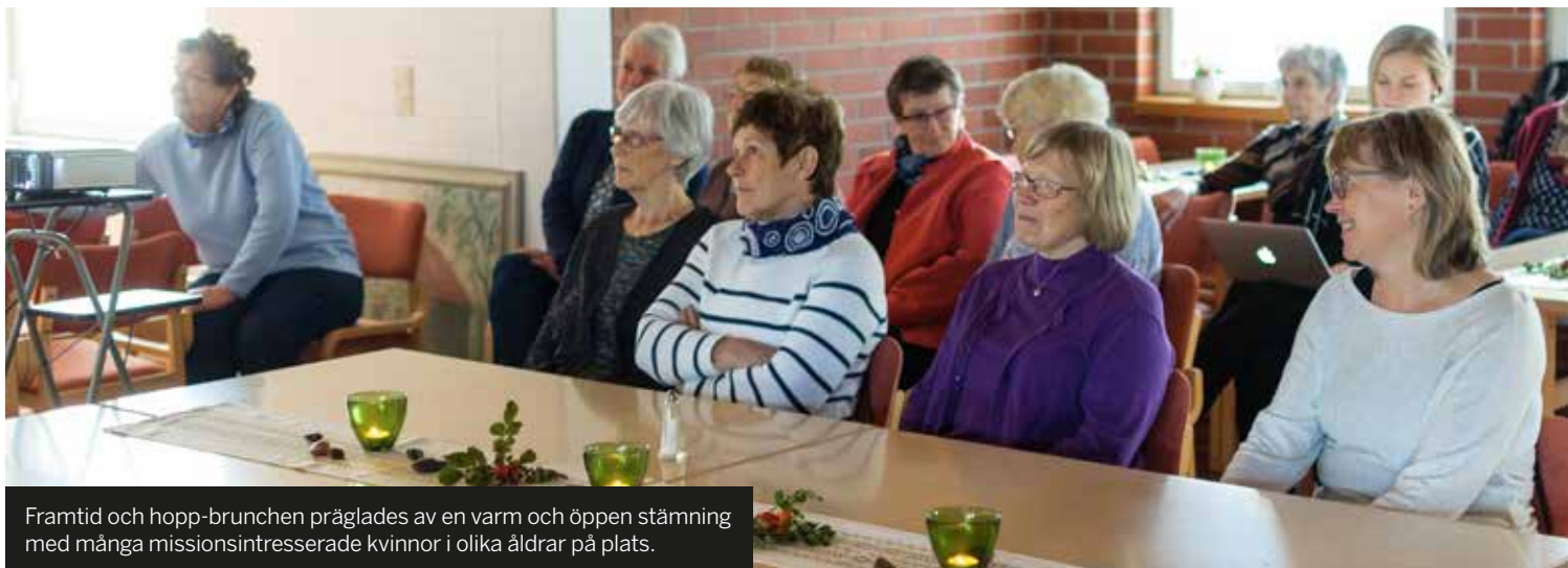
Framtid och hopp-brunchen präglades av en varm och öppen stämning med många missionsintresserade kvinnor i olika åldrar på plats.