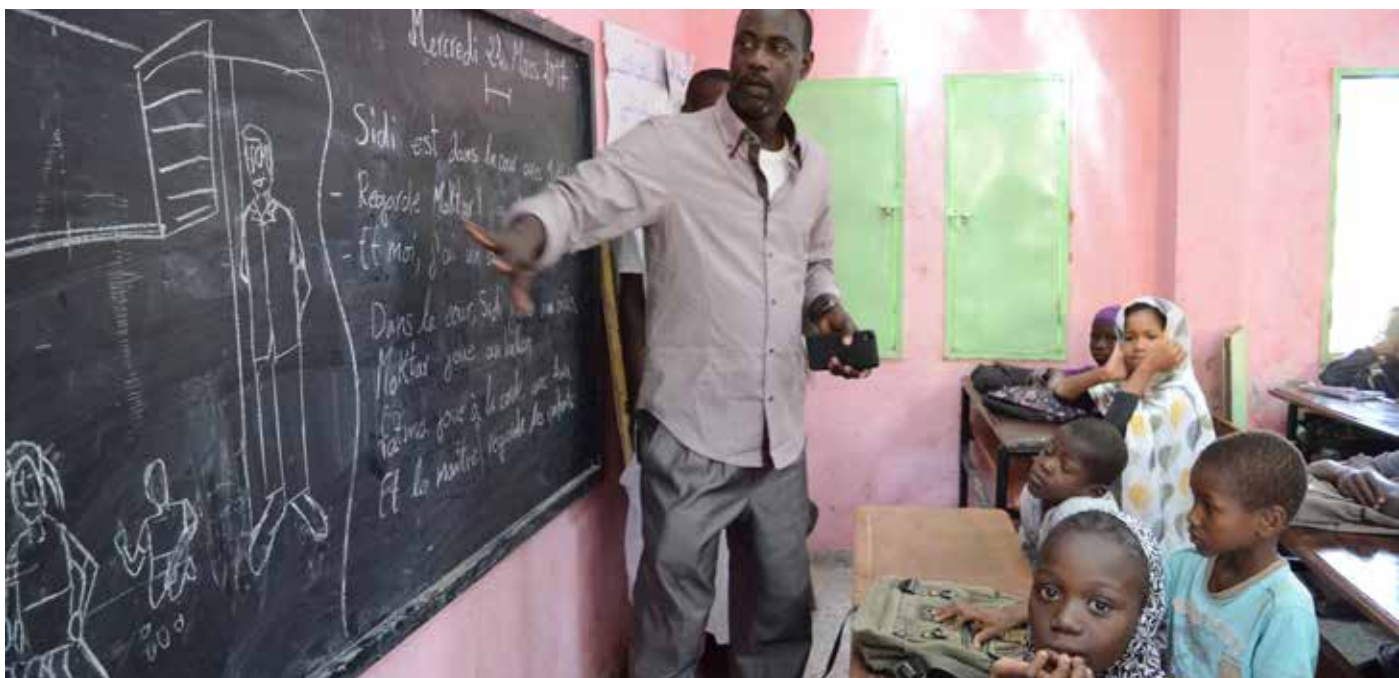
I huvudstaden Nouakchott får barn i fyra skolor hjälp tack vare Finska Missionssällskapets faddrar.

www.finskamissionssallskapet.fi/fadderbarn