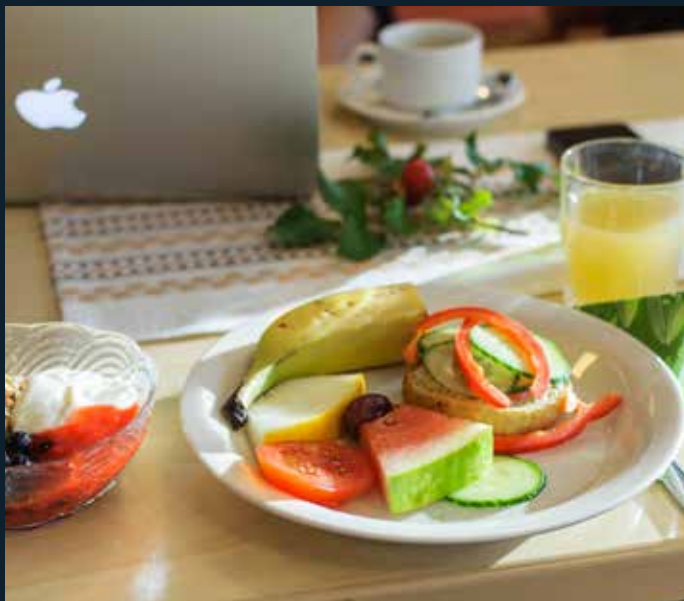
Många läckerheter på tallrikarna vid brunchen i Bennäs.