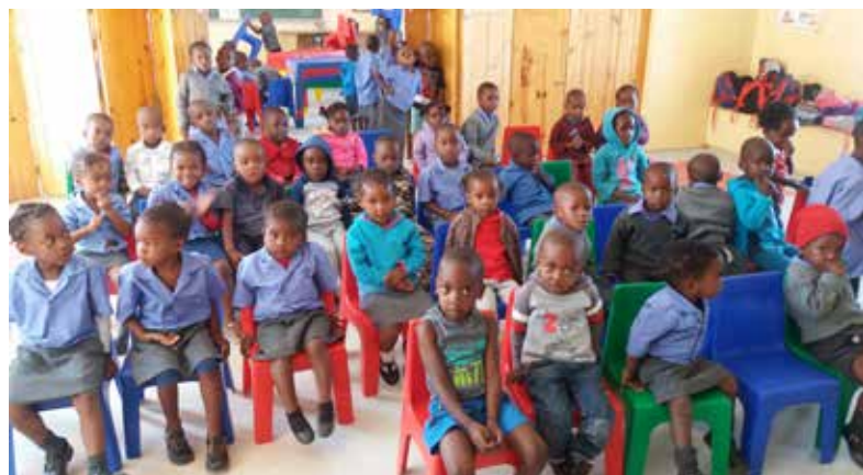
Trygga rutiner på Emmanuel daghem.

– Den 18 januari reser jag till Etiopien, där jag ska verka bland Finska Missionssällskapets fadderbarn vars familjer drabbats av hiv/aids och bland barn som lever med funktionshinder.