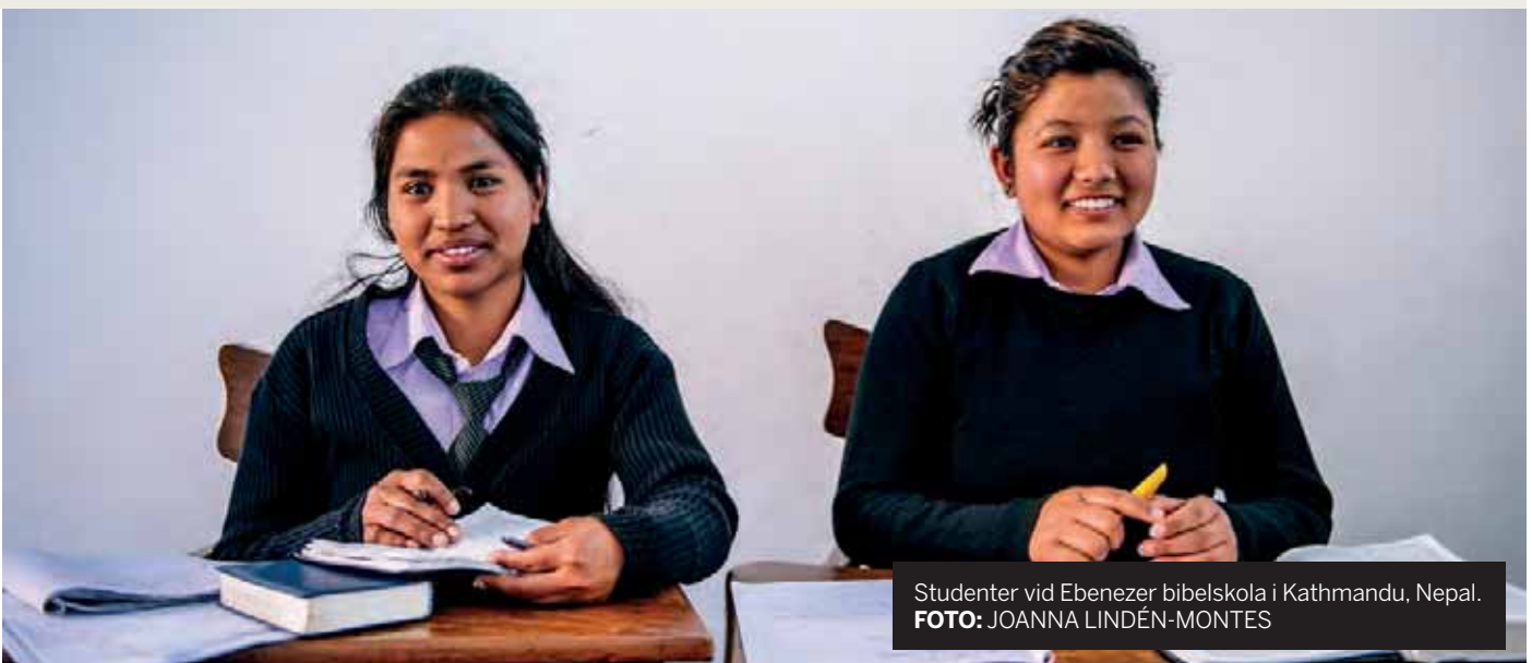
Studenter vid Ebenezer bibelskola i Kathmandu, Nepal.