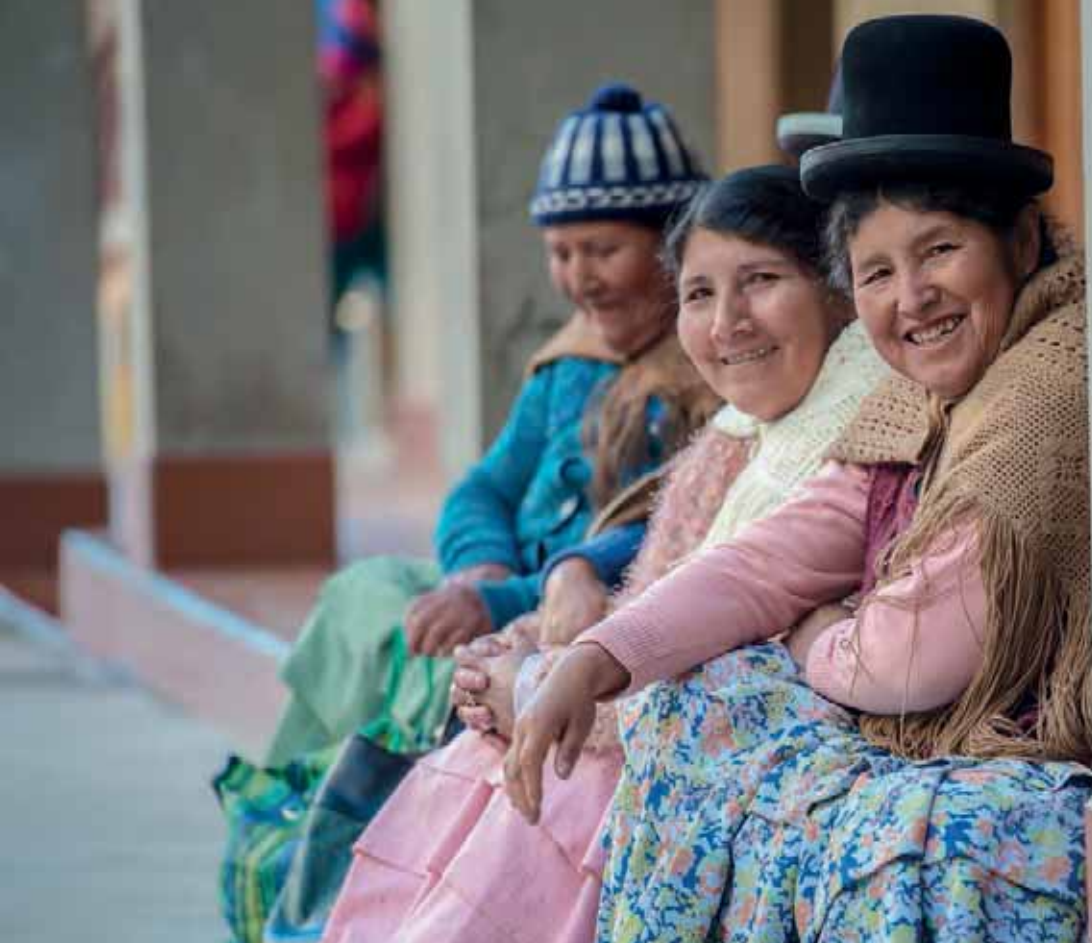
Finska Missionssällskapet stöder den lutherska kyrkan i Bolivia. Medlemmarna tillhör olika urfolk.