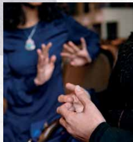
Finska Missionssällskapet hjälper befolkningen bygga fred i Syrien.