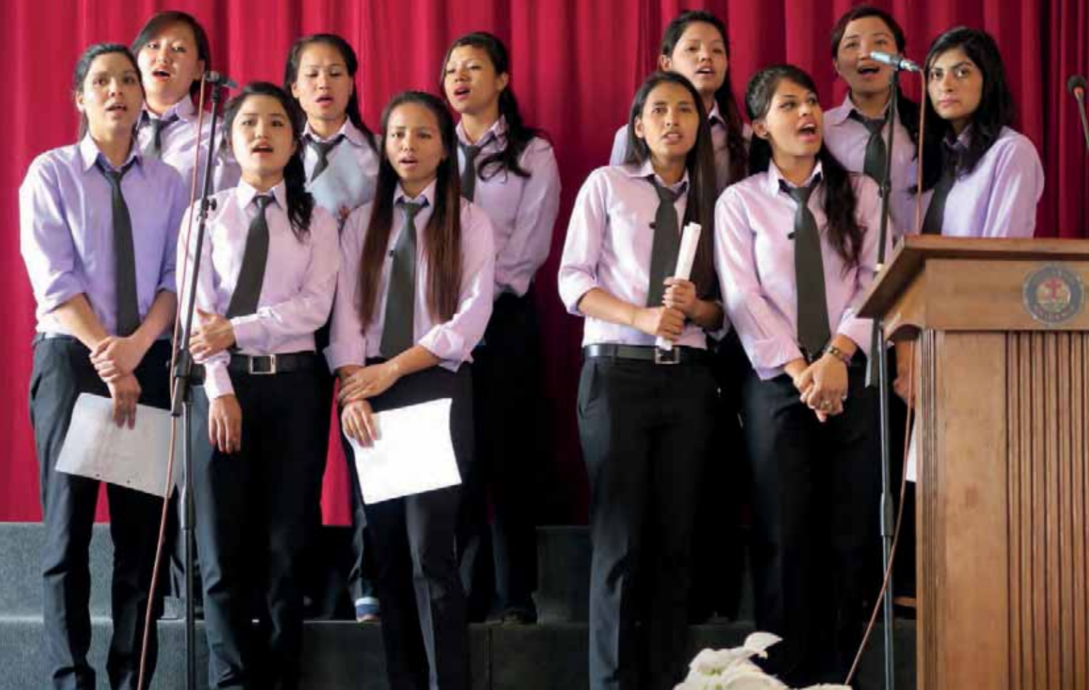
Första årskursens flickor uppträder med sång.