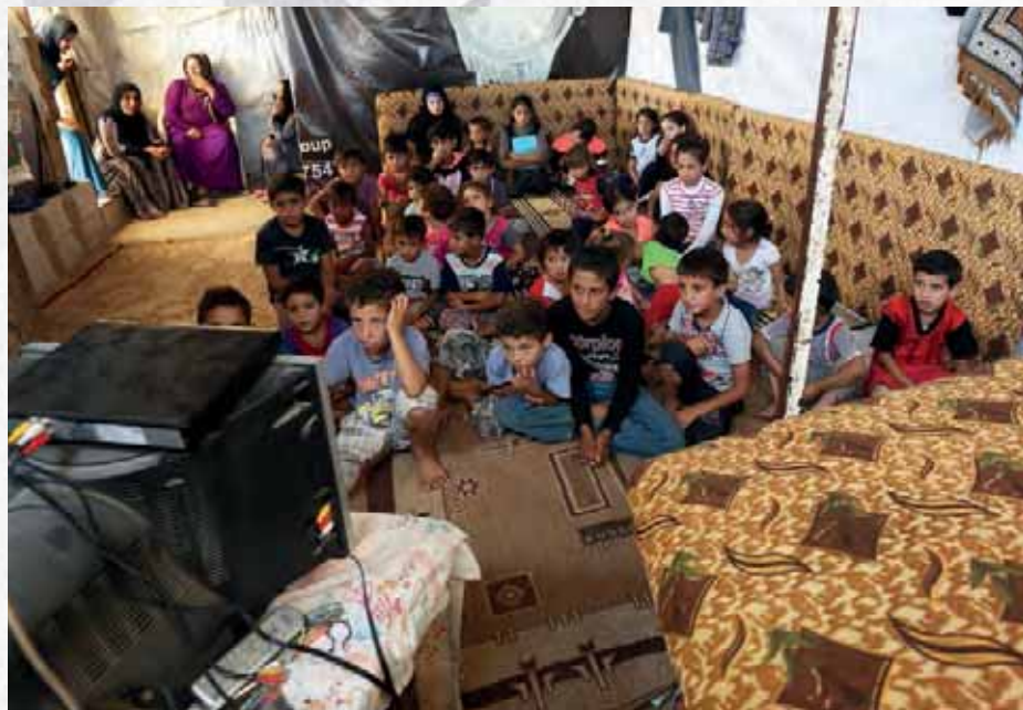
Undervisning med hjälp av tv-programmet Min skola i ett flyktingläger.

”Många barn visste först inte ens hur man håller en penna, och som följd av de trauman de utsatts för var det några som inte talade eller ens sa vad de hette”, säger