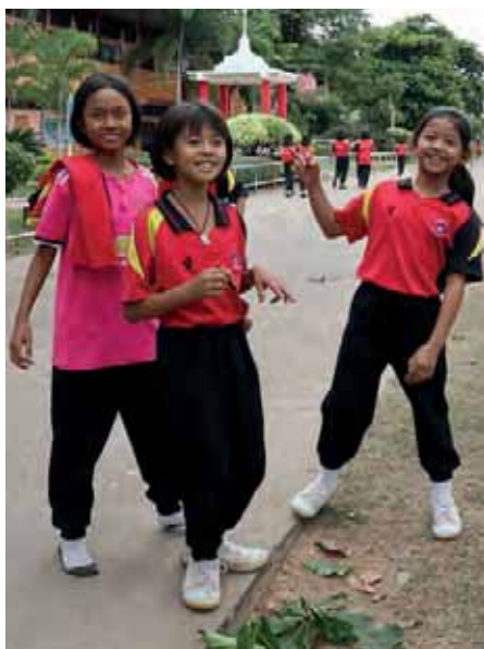
Faddereleverna idrottar varje torsdag.

i området förekommer våld, alkoholism och utnyttjande. En del av föräldrarna kommer från Laos och är papperslösa. Många föräldrar sitter i fängelse eller så har de lämnat barnen hos mor- och farföräldrar eller grannar och åkt iväg för att söka jobb på andra orter. Lärarna är glada över att kyrkan på eftermiddagarna erbjuder barnen stödundervisning och hjälp med läxläsningen.