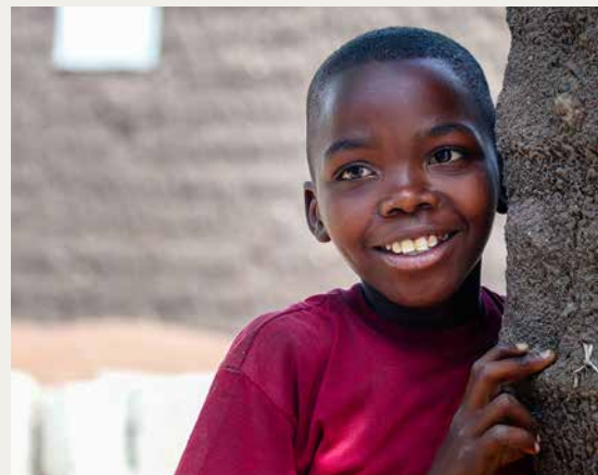
Finska Missionssällskapet strävar efter förändring, bland annat genom att utbilda diskriminerade folkgrupper och ge dem möjligheter att påverka sitt samhälle. FOTO: VIRVE RISSANEN/TANZANIA

Hjälpbehoven hos Missionssällskapets samarbetskyrkor och partnerorganisationer har ökat. Kriget i Ukraina med den påföljande inflationen och höjda energipriser har tillsammans med klimatförändringen och en global livsmedelskris försatt allt flera människor i nöd i utvecklingsländerna.