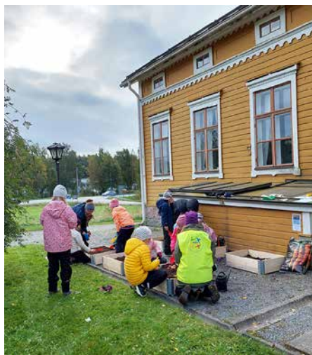
Elever från Sundom skola sädde frön vid prästgården under höstens Utjämningskampanj.