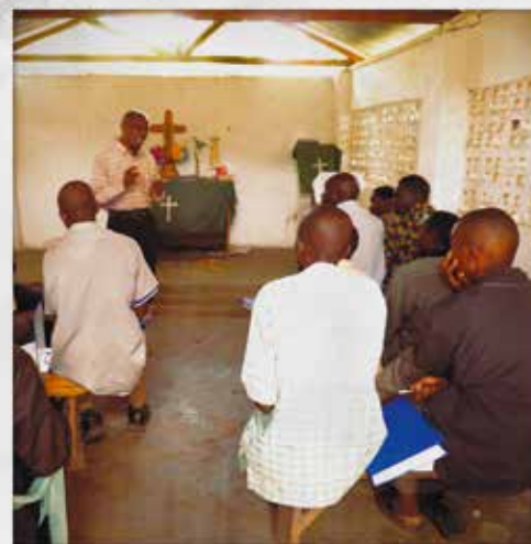
Präster och evangelister på seminarium i Mtamba kyrka.

Finska Missionssällskapet verkar i 30 länder tillsammans med lokala kyrkor och organisationer. Församlingarna i Borgå stift och privatpersoner i Svenskfinland understöder projekt och missionärer i 13 länder.