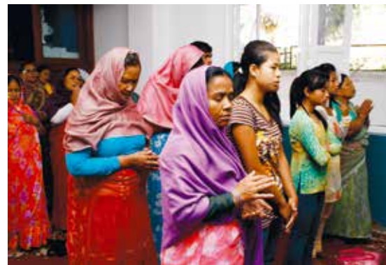
I Patans kyrka i Kathmandudalen reserverar man mycket tid för bön och lovsång i gudstjänsten.