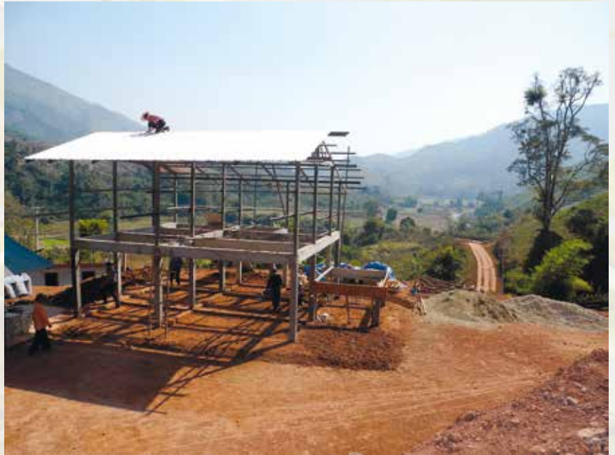
Finska Missionssällskapet bygger ett församlings- och språkcentrum med inkvartering i byn Ban Napong.