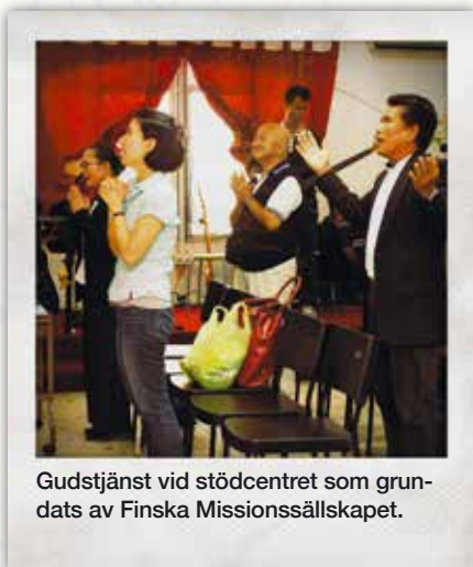
Gudstjänst vid stödcentret som grundats av Finska Missionssällskapet.

När dagens gudstjänst skall börja har rummet fyllts av thailändare.