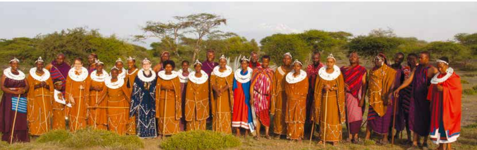
Massajkören Loruvani Choir uppträder på missionsfesten, bland annat på lördagen vid programpunkten "Vägar till tro" klockan 10-11.30.