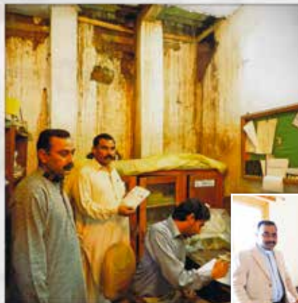
Den gamla byggnaden förstördes av termiter och ett läckande tak. På bilden till höger, den nya lokalen.

kontorslokalen, där vi ställde oss i en ring och bad. Biskopen välsignade byggnaden, säger Ben Westerling , Finska Missionssällskapetets regionchef för arbetet i Nepal och Pakistan.