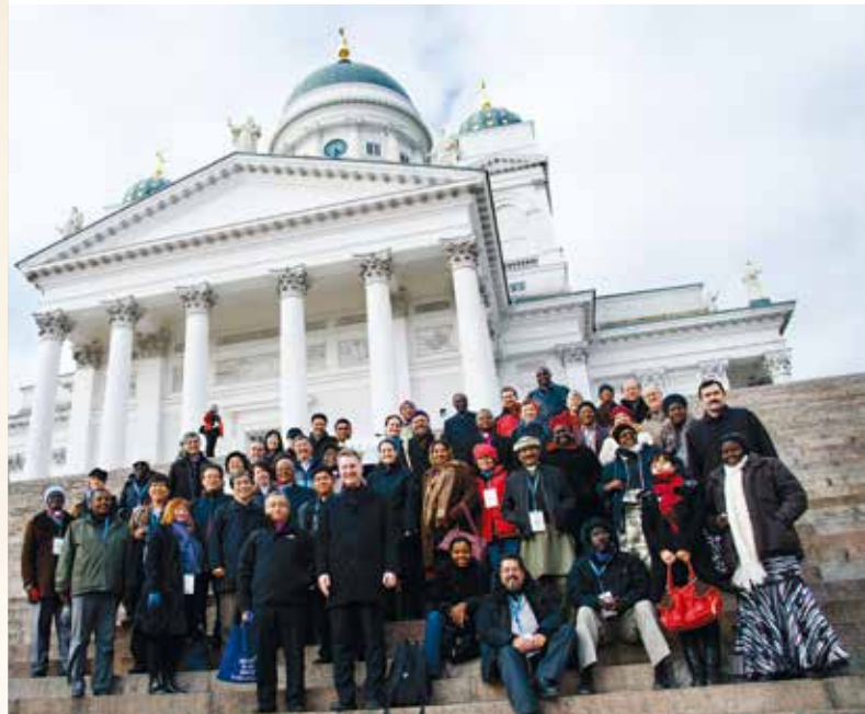
Finska Missionssällskapet och Evangelisk-lutherska kyrkan i Finland diskuterade kyrkans mission tillsammans med representanter från 30 kristna kyrkor i mars och april.