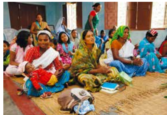
Det diskriminerade santalfolket får upprättelse i den lutherska kyrkan i Nepal.