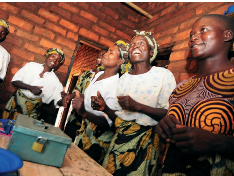
Framåt med egna sparpengar. Spar- och lånegruppens medlemmar uttrycker sin glädje med sång och dans. Byborna bygger själva upp ett startkapital för smålån, som i sin tur ger ränteinkomster för gemensamma odlingsprojekt.