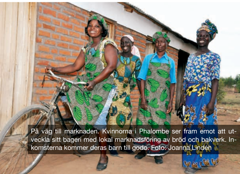
På väg till marknaden. Kvinnorna i Phalombe ser fram emot att utveckla sitt bageri med lokal marknadsföring av bröd och bakverk. Inkomsterna kommer deras barn till godo.