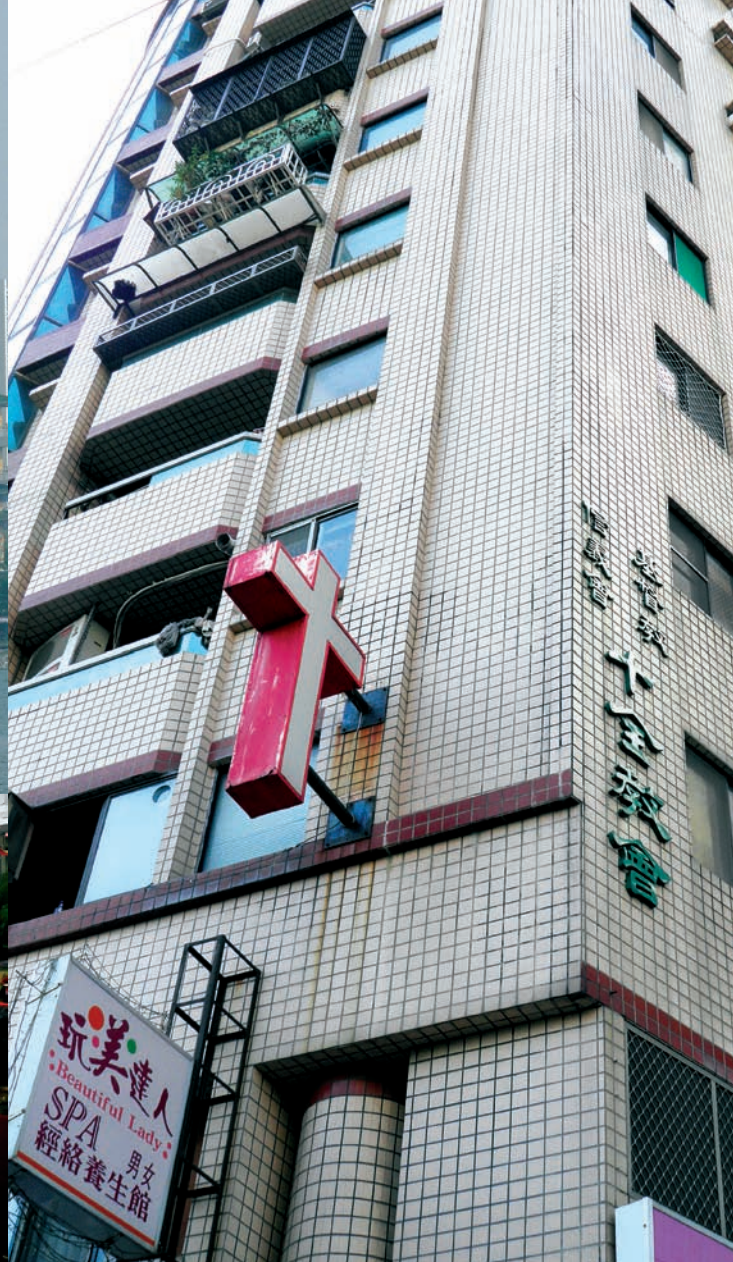
Den lutherska kyrkan Shi Quan utifrån.