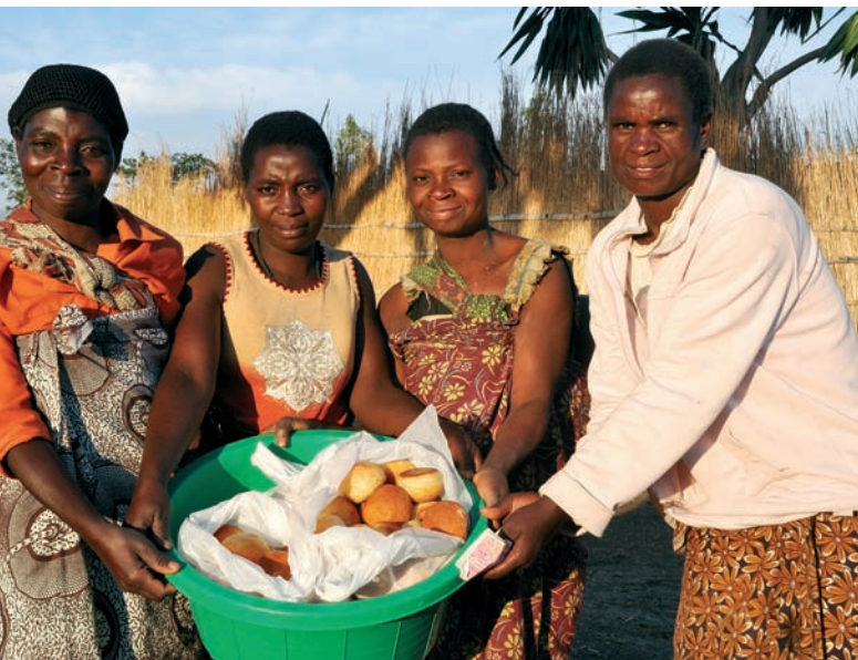
Nybakade scones till försäljning. Enkla lösningar, som till exempel ett bybageri, ger kvinnorna egna inkomster. I Malawi hjälper den lutherska kyrkans utvecklingsavdelning kvinnorna att starta små företag.