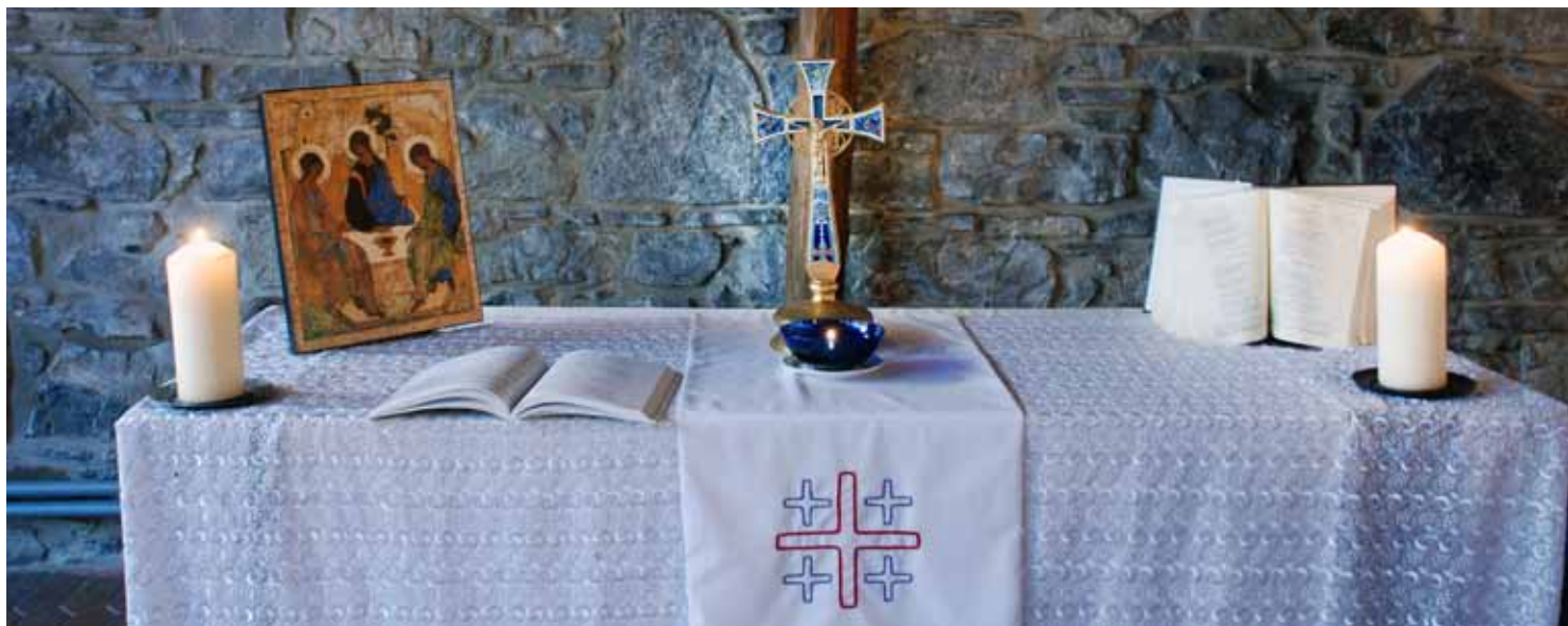
Stillhet och ro i det ekumeniska kapellet i Bossey.