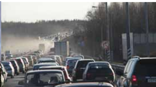
Så här kan en vanlig vardag se ut för lokalbefolkningen i ett land med många invånare och bilägare.