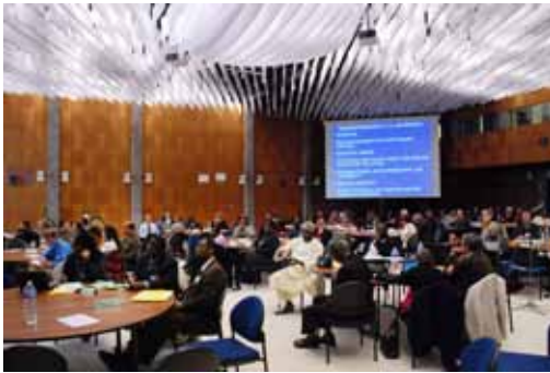
FN:s vecka för påverkansarbete ordnades i samarbete med Kyrkornas världsråd i Genève. Sessionen om Israel-Palestina den 28 september fokuserade på mänskliga rättigheter.