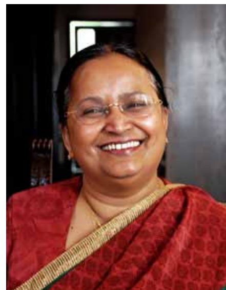
Text och foto: Joanna Lindén

– Jag har hunnit samla mycket material under årens lopp. Nu ser jag fram emot möjligheten att kunna ge ut en bok med andakter som fokuserar på kvinnor.