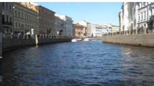
Esse församling hann också kryssa fram på kanalerna i centrum av Sankt Petersburg.