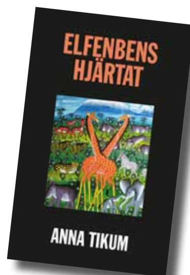
Elfenbenshjärtat , Annas debutroman, sätter ord på hemlängtan och kulturkrockar.