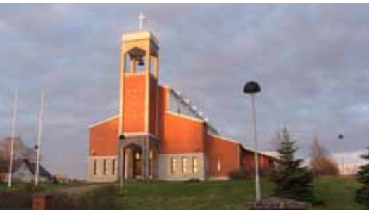
Kyrkan i Keltto har byggts med finländskt stöd. Idag besöks kyrkan ofta av finländska turister.