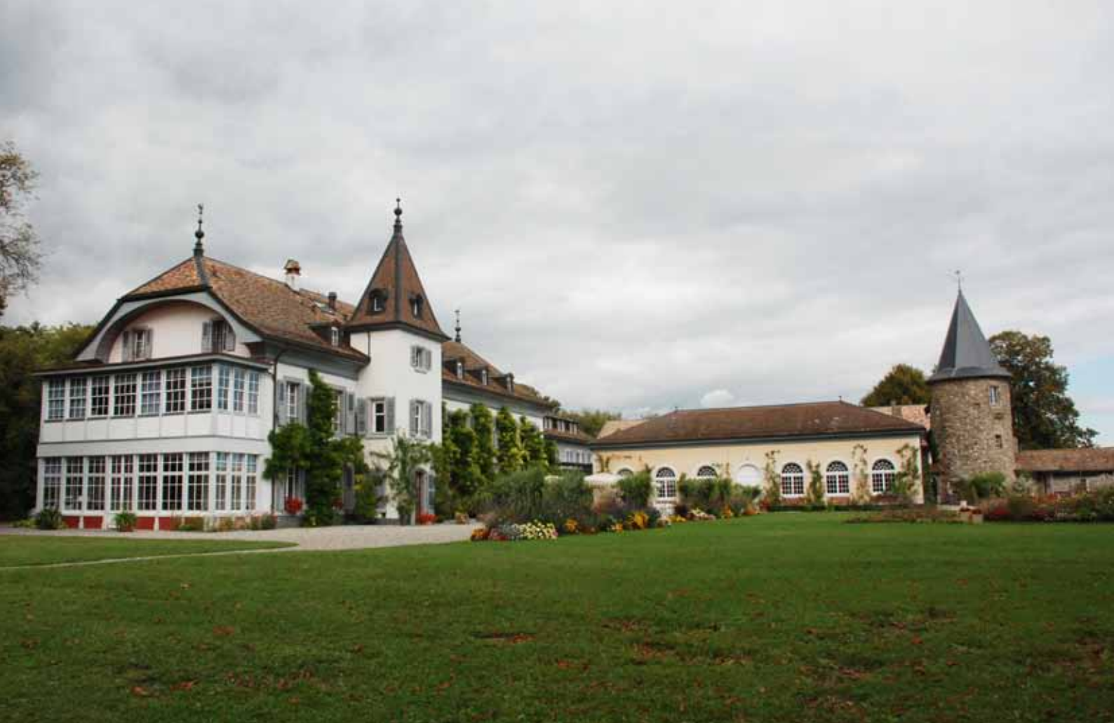
Château de Bossey, centret för ekumenisk bildning i Schweiz.