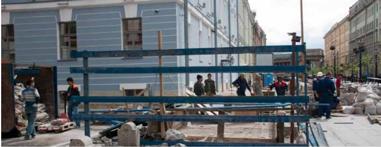
Det finns miljontals gästarbetare från Asien i Ryssland. Många lockas av möjligheterna till byggnadsarbete i Sankt Petersburg. Keltto församling når ut till en del av de hjälpbehövande.