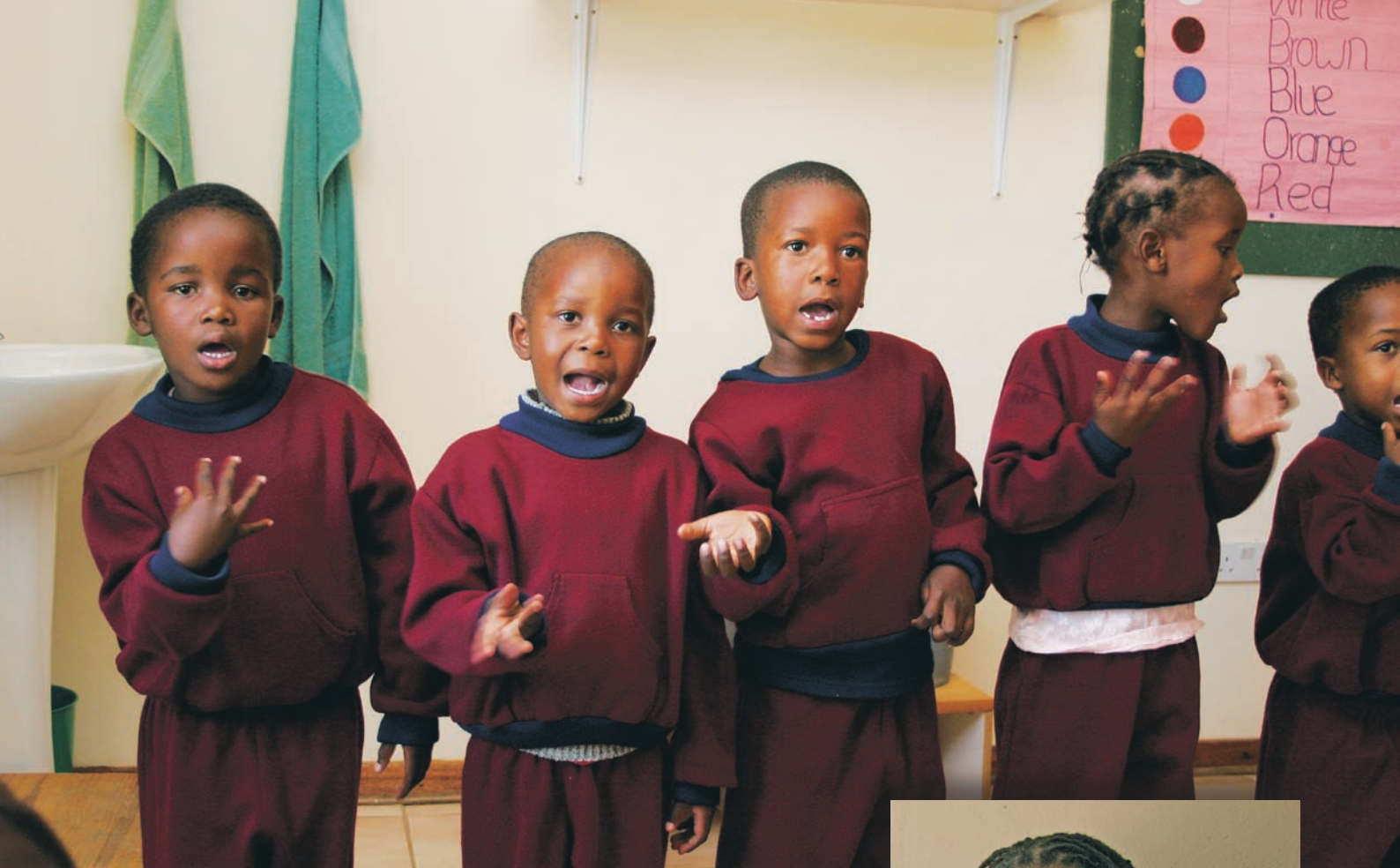
Barnen lär sig färger, månader och årstider på engelska med hjälp av sånglekar.