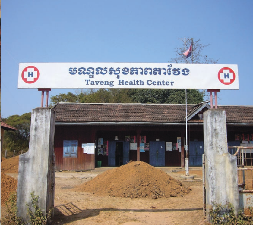
Pipa i mun och barnet vid bröstet gör köandet till klinikmottagningen lättare. / En anspråkslös men viktig port till hälsa i byn Taveng.

” Hon fick höra vid sin ankomst till Kambodja att några kristna i Banlung hade bett för någon, som drabbats av en svår kulturchock. Det var ju hon själv!