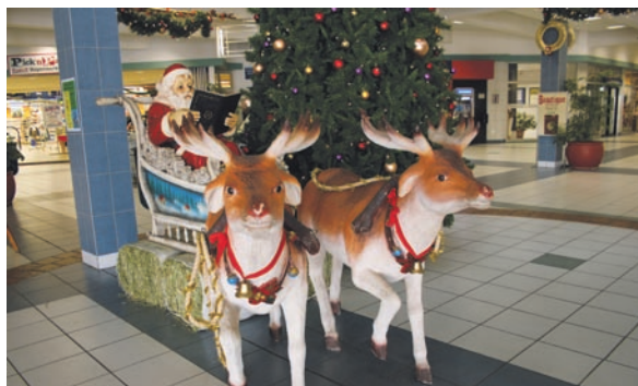
Julgubben har anlänt till Windhoek i Namibia, med vägkost under släden för renarna.

Den förnyade utställningen öppnas den 19 januari 2009.