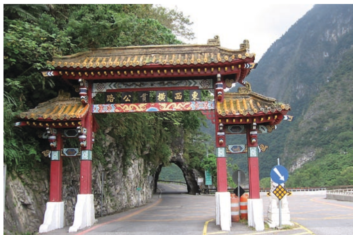
Huvudingången till nationalparken Taroko Gorge i Taiwan.