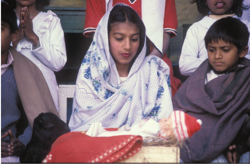
Pakistanska Maria lade Jesusbarnet i en apelsinlåda och klädde honom i röd yllemössa för att han inte skulle frysa. Herdarnas riktiga killingar var succé under juldramat i Christ Church School i Nowshera – speciellt då de rymde.