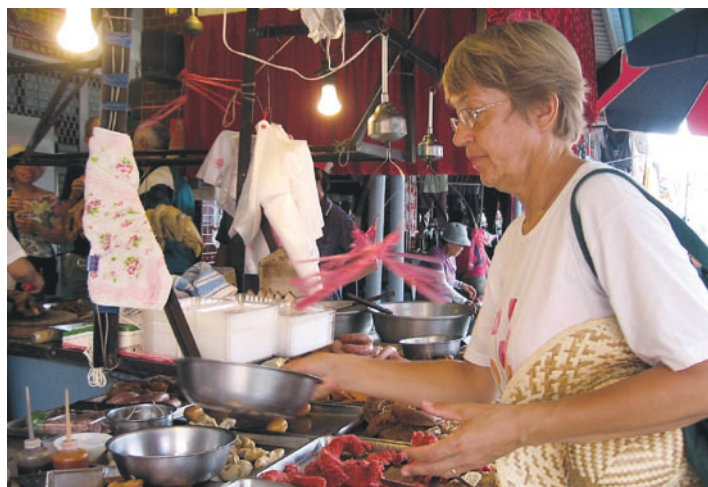
Delikatesser för olika smak och tycken.