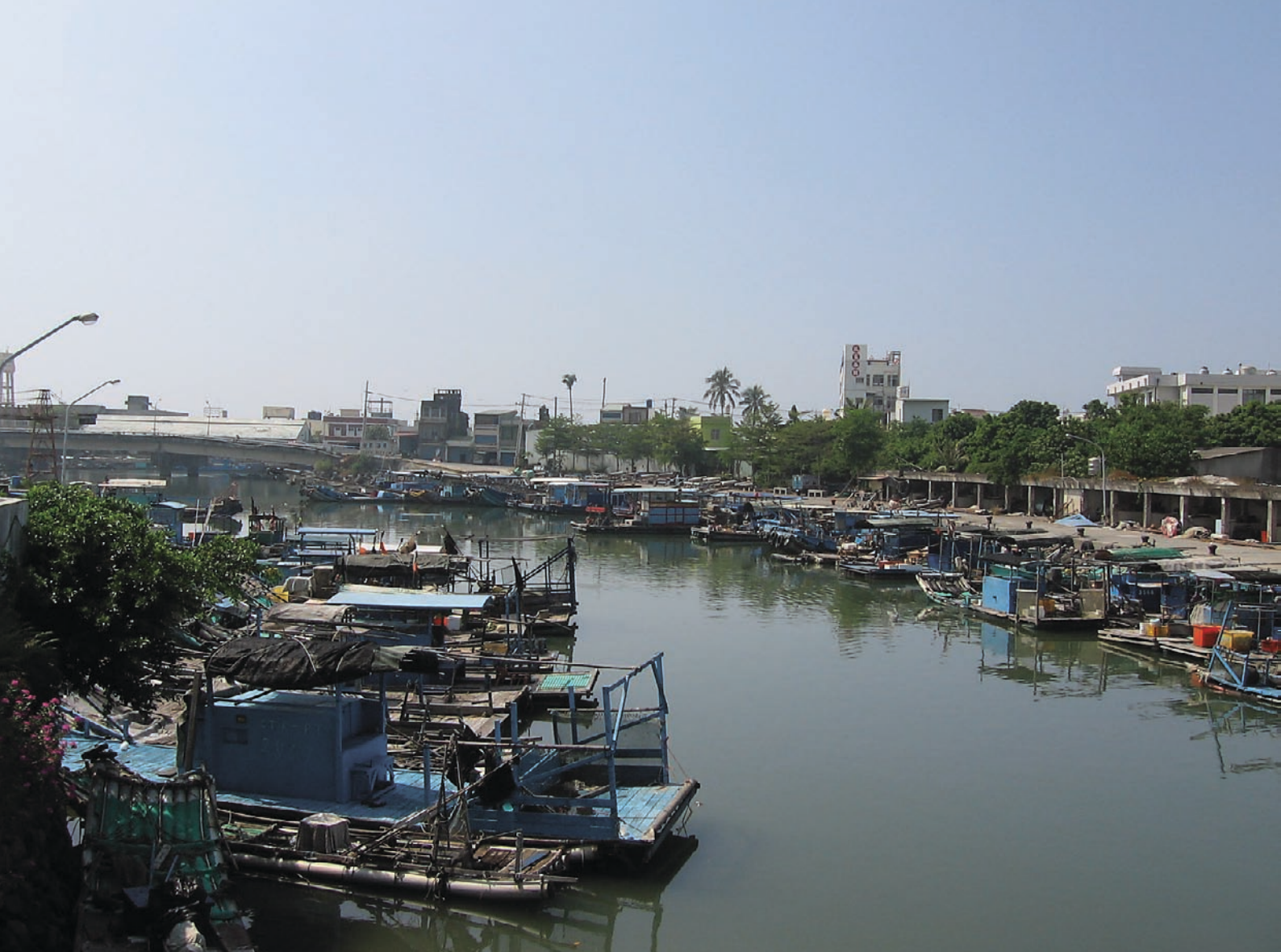
Hamnen i Fangliao med traditionella fiskebåtar ligger mitt i stadens larm.