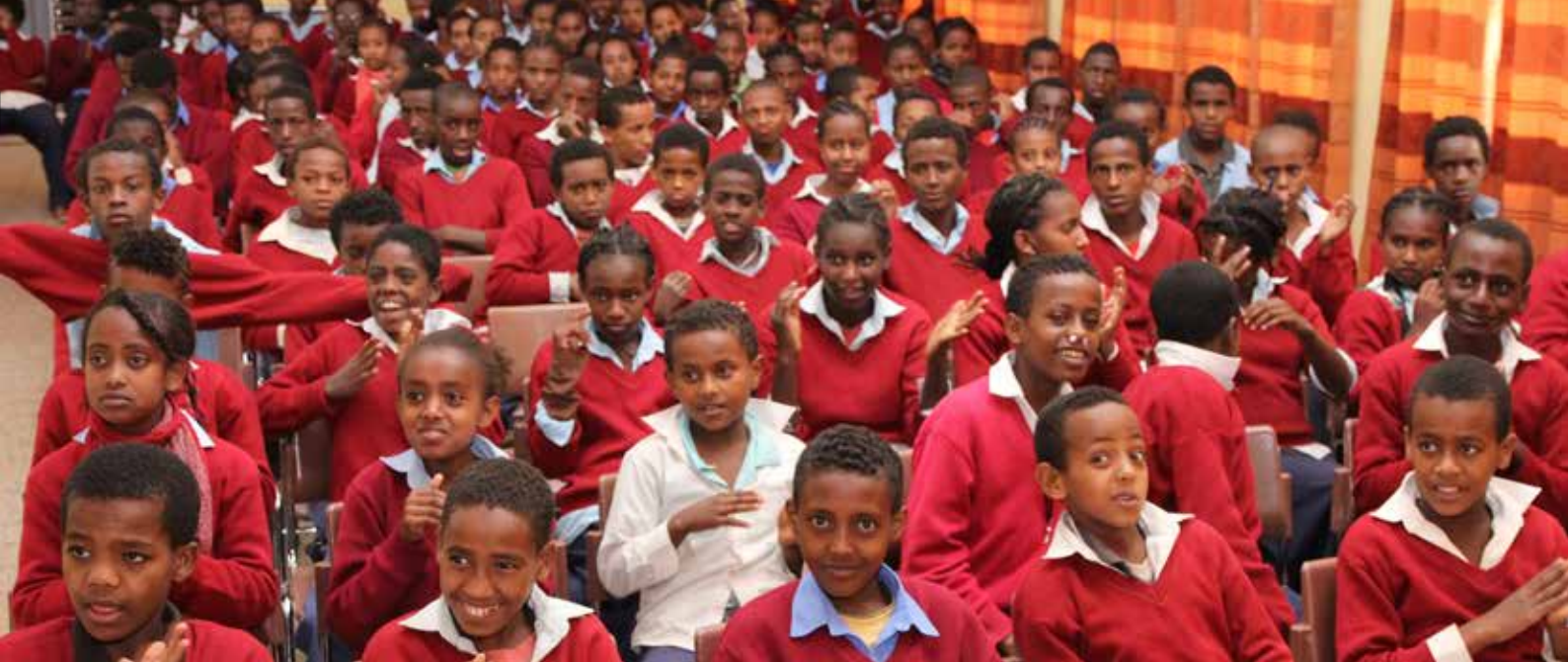
Glada barn på morgonandakt i dövskolan i Hosaina.