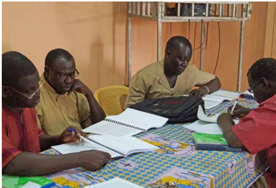
Kyrkans präster på diakoniseminarium.

- Arbetet ligger nära mitt hjärta - jag arbetade ju länge inom diakonin i Åbo. När jag tar mig an nya utmaningar i Senegal upplever jag ofta att vägen har blivit beredd för mig. Det är nog tack vare förbönerna. Jag är så tacksam för dem. Fortsätt be!