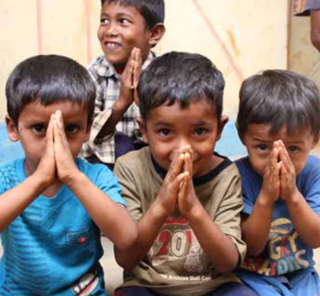
Finska Missionssällskapet vill trygga barnens skolgång efter jordbävningarna i Nepal.