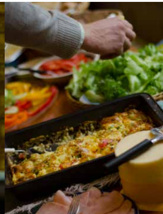
Förra hösten ordnade vi den första missionsbrunchen med temat "Du kan påverka" i Helsingfors. Målgruppen var unga vuxna.