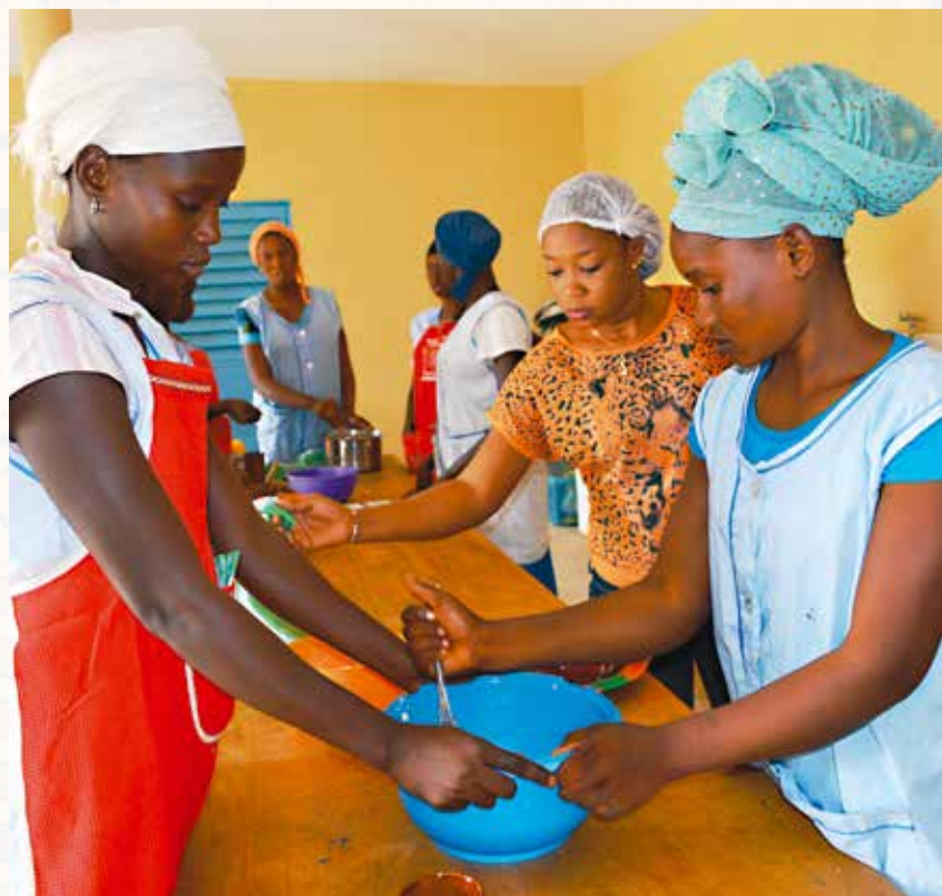
Vid utbildningscentret bakar kvinnorna kakor, pastejer och små munkar.