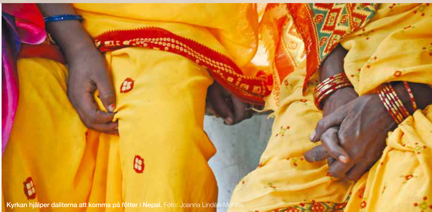
Kyrkan hjälper daliterna att komma på fötter i Nepal.

Skribenten deltog i Finska Missionssällskapets studieresa till Nepal i april 2014.