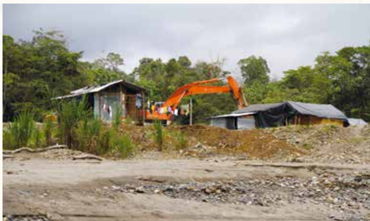
Den väpnade konflikten i Colombia när sig på den illegala gruvindustrin. Urfolket hamnar i kläm och människorättsaktivister lever under dödshot.

Enligt FN finns det över 370 miljoner representanter för urfolk i över 70 länder. Urfolket är mera sårbara än övrig befolkning. I till exempel Colombia, ett av de länder där Finska Missionssällskapet verkar för mänskliga rättigheter, är 40 olika urfolk hotade. De hotas av inbördeskriget och gruvindustrin. När människor försöker kräva sina rättigheter faller de ofta offer för våld, tortyr, kidnappningar eller mord.