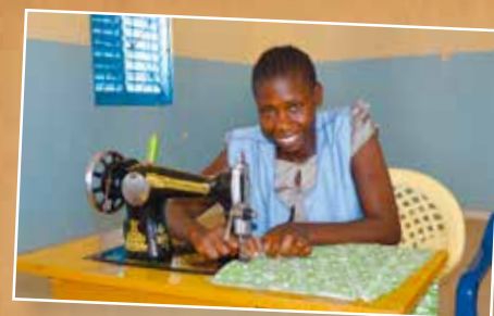
Senegals lutherska kyrka ordnar yrkesutbildning med fadderstöd.

Det finns tusentals flickor som Gennet. De lever undgängömda, utan hopp om något bättre. Genom att stöda Utjämningen kan du vara med och göra deras röster hörda och förändra deras liv. Läs mer på sidorna 12-15.