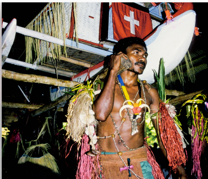
Nya testamentet på takia-språket tas i bruk med festligheter i Papua Nya Guinea 1999.