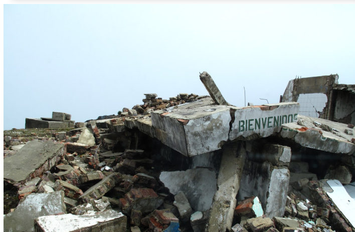
Bienvenidos - välkomna. Alla "gäster" har inte varit lika välkomna.

På www.utjamning.fi finns mer information om Utjämningen: temaartiklar, colombianskt besök på skriftskolläger, bloggar, bilder, m.m.