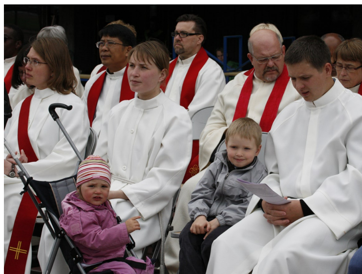
Familjen Heikkilä välsignades till missionsarbete i Ryssland på Ratina Stadion i Tammerfors 6.6.2009.