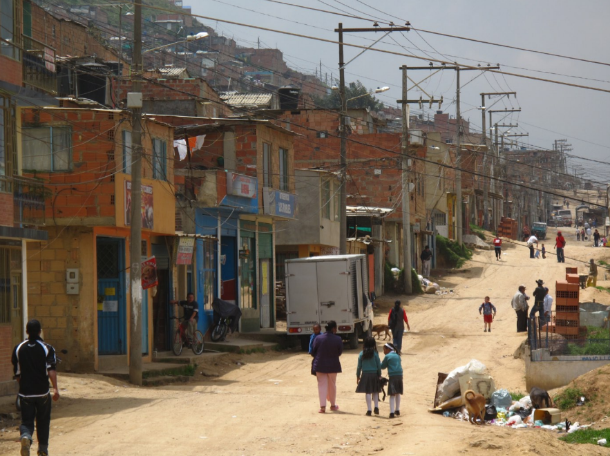
Inte rum i härberget. Interna flyktingar bosätter sig på sluttningarna utanför Bogotá, bl.a. Caracolí.