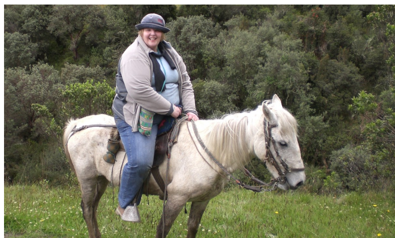
"Framåt kamrater ropet går..."

Skribenten är sekreterare för barn- och ungdomsarbetet vid Finska Missionssällskapet