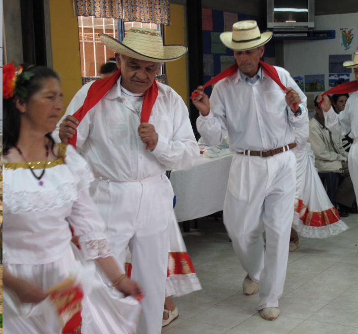
Den lutherska kyrkans stödcenter för seniorer i Soacha erbjuder gratis lunch, psykologstöd, tandvård och hobbyverksamhet. Folkdansgruppen leds av seniorerna själva.