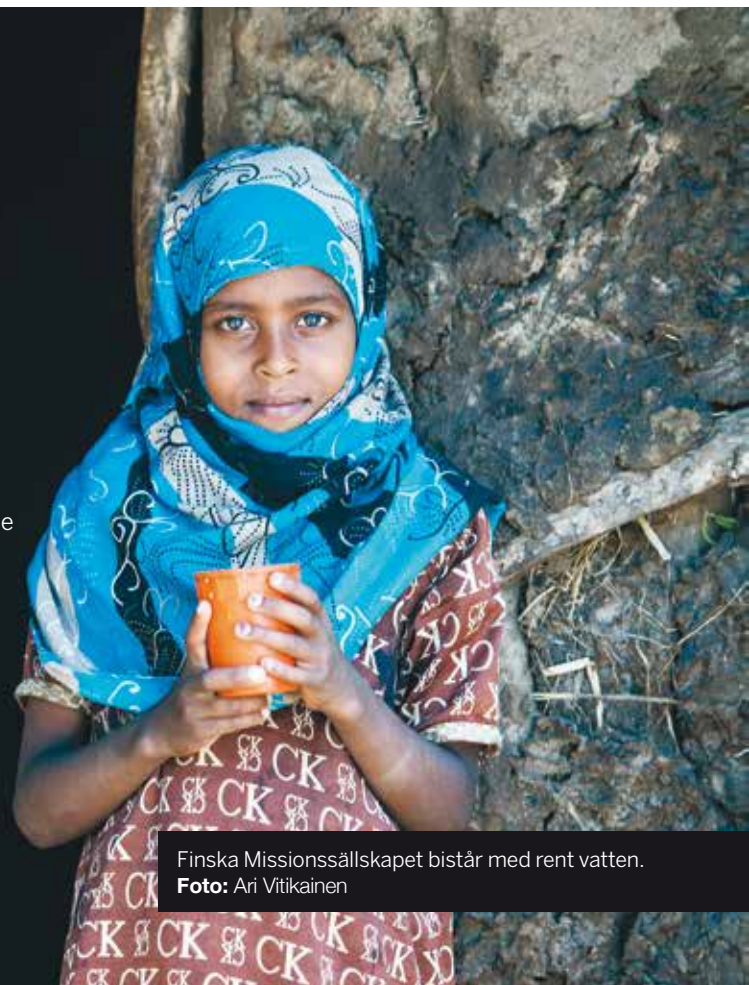
Finska Missionssällskapet bistår med rent vatten.