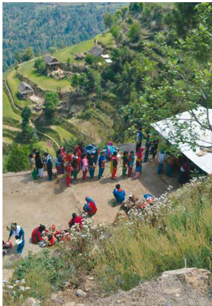
Mia var med om utbildning för söndagsskollärare i bergen. Organisationen som ordnar utbildningarna har drabbats av den nya kriminallagen.