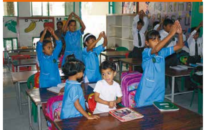
St Johns School i Peshawar stifts stöds av Finska Missionssällskapet. Skolan har 350 elever.

”Kyrkan i Pakistan tackar för allt stöd och framför allt all förbön under de svåra åren med terrordåd mot kyrkor och kristna. Kyrkans skolor är speciellt tacksamma för den materiella hjälpen. De fick hjälp med att bygga skyddsmurar för att kunna skydda sig mot terrordåd. Fortsätt be för Pakistan”, säger Ben.