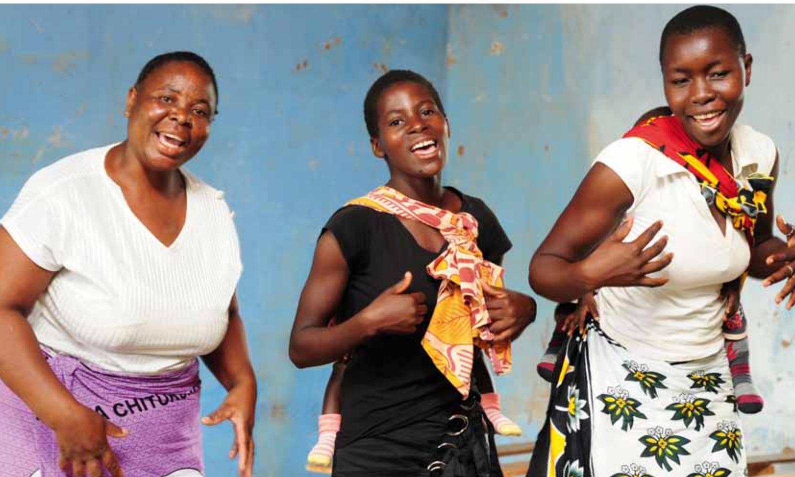
Kvinnogruppen Tuntuakwata , "Allt har sin början" visar sin uppskattning med sång och dans i kyrkan. Kvinnorna har getts chansen att förbättra sina familjers utkomstmöjligheter i samarbete med Malawis evangelisk-lutherska kyrkas utvecklingsavdelning.