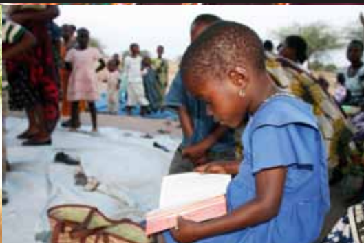
En flicka bekantar sig med bibeln.