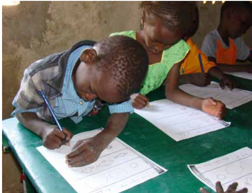
I församlingens dagklubb lär sig barnen hur man använder en penna och får andra färdigheter som behövs i skolan.