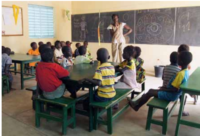
Barnen på landsbygden får gå i förskola tack vare församlingarnas verksamhet.