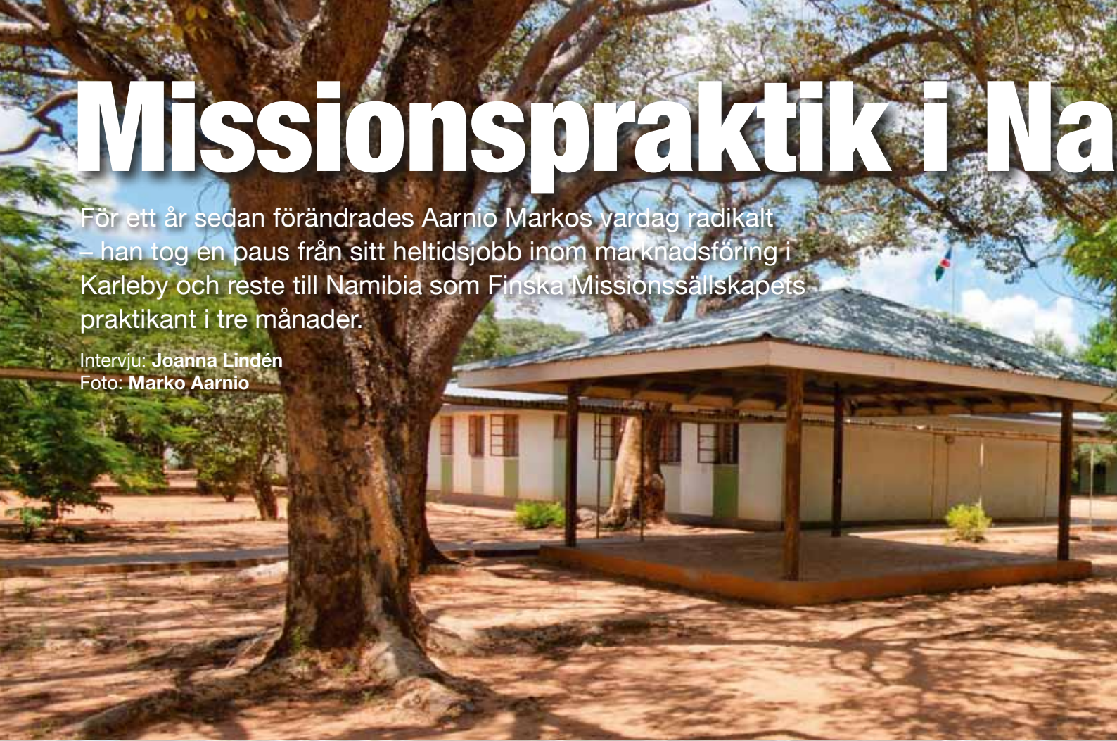
Den lutherska kyrkans högstadium Nkurenkuru.