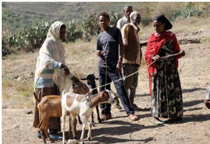
Två samhällen i Gasara-området har mottagit både mathjälp och getter, höns och redskap. ”Getterna ger en kopp mjölk morgon och kväll. Vi ger mjölken åt barnen.”