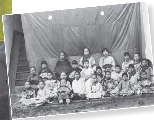
Första klassfotot av Sally Lampéns flickskola 1908 i Jinshi – och 100 år senare i samma trakt.