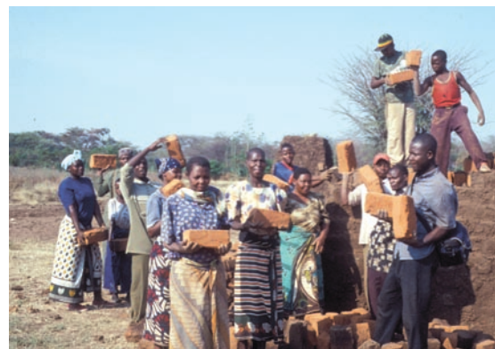
Ung energi och tegeltillverkning.

Du som vill stöda arbetet, men inte får Finska Missionssällskapets insamlingsbrev hem på posten, kan ge en gåva till Sampo 800014-161130. Skriv EVA1 i meddelanderutan. Tack för din gåva!