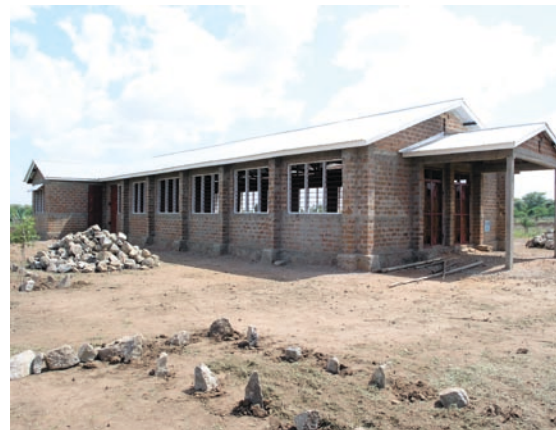
Kyrkan är färdig. Det är ett under.