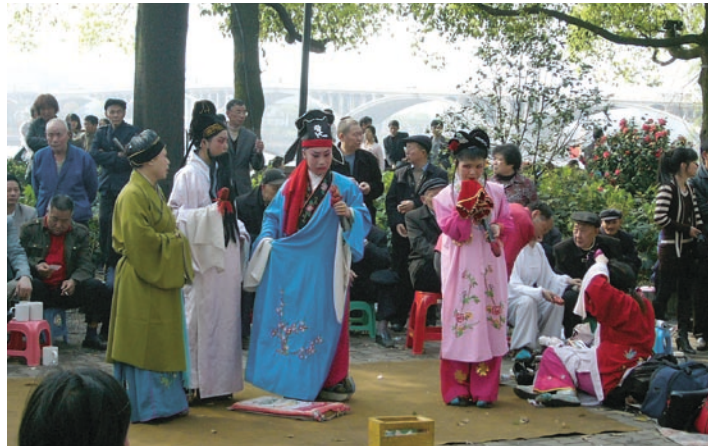
Kinesisk opera på strandpromenaden vid Xiangfloden gläder changshaborna.

– En annan dag blev jag stoppad vid porten till en föreläsningsbyggnad av en flicka, som behövde hjälp med sin engelska läxa, fortsätter Håkan.