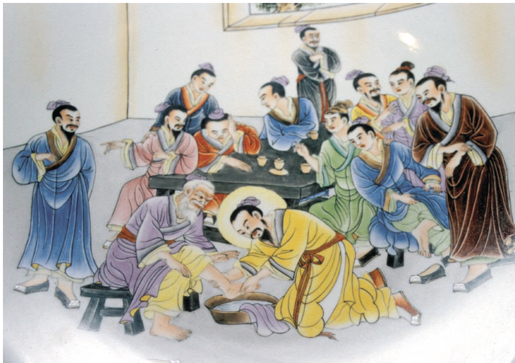
Jesus tvättar lärjungarnas fötter. Kinesisk porslینmålning Tao Fong Shan Porcelain Workshop, Hongkong.