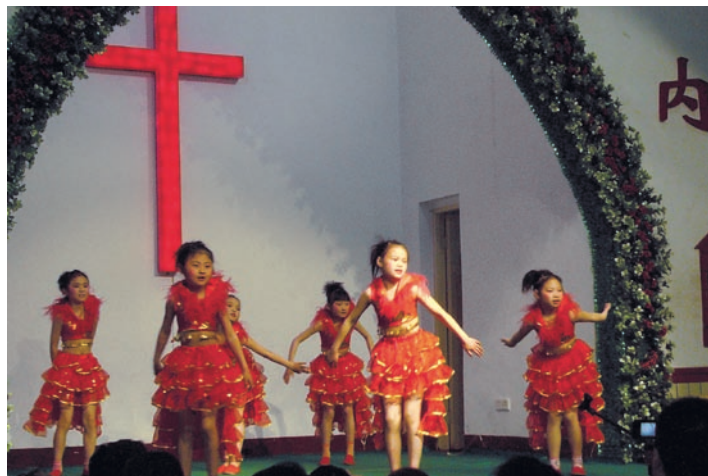
Kulturell påskglädje i församlingen. Ett fyrtiotal nya medlemmar döptes i samma gudstjänst.