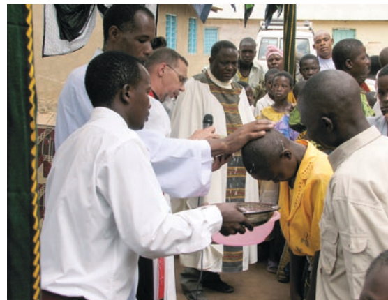
Över 130 personer döptes i gassande sol. Nu har Mwamitumai församling över 200 medlemmar.