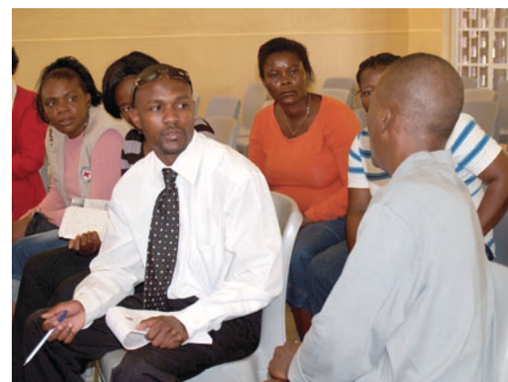
Aktiva invånare och beslutsfattare är medvetna om bibliotekets betydelse i samhället.

skribenten är pedagogisk informatiker vid Helsingfors stadsbibliotek och har varit aktiv i Furahakören