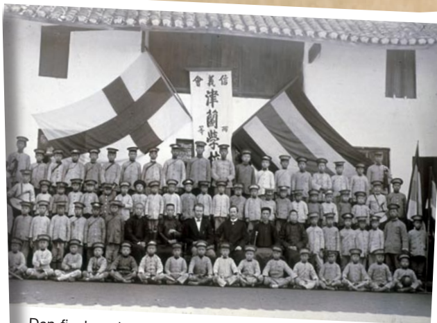
Den finska missionsskolan i Jingshi flaggar för modern kunskap.