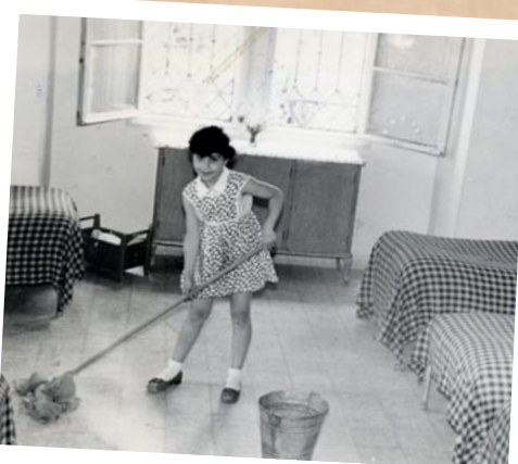
Städtur på finska skolan i Jerusalem.