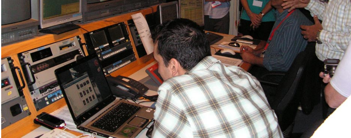
Från SAT-7:s kontrollrum sänds kristna program för vuxna och barn till miljoner tittare i Mellanöstern och norra Afrika.

>> visste jag väldigt lite om arabiska kristna och regionen överlag. Måste erkänna att jag också hade en uppfattning om att Cypern låg närmare Grekland. Nu har vi lärt känna bl.a. syriska, libanesiska, jordanska, palestinska, egyptiska och cypriotiska kristna.