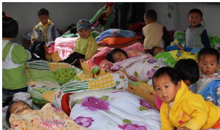
Dags att sova middag i Jiulongsskolas daghem. Efter jordbävningen fick barnen konstterapi, där de genom att teckna gick igenom det som hänt. 22 av daghemmets barn omkom i jordbävningen.