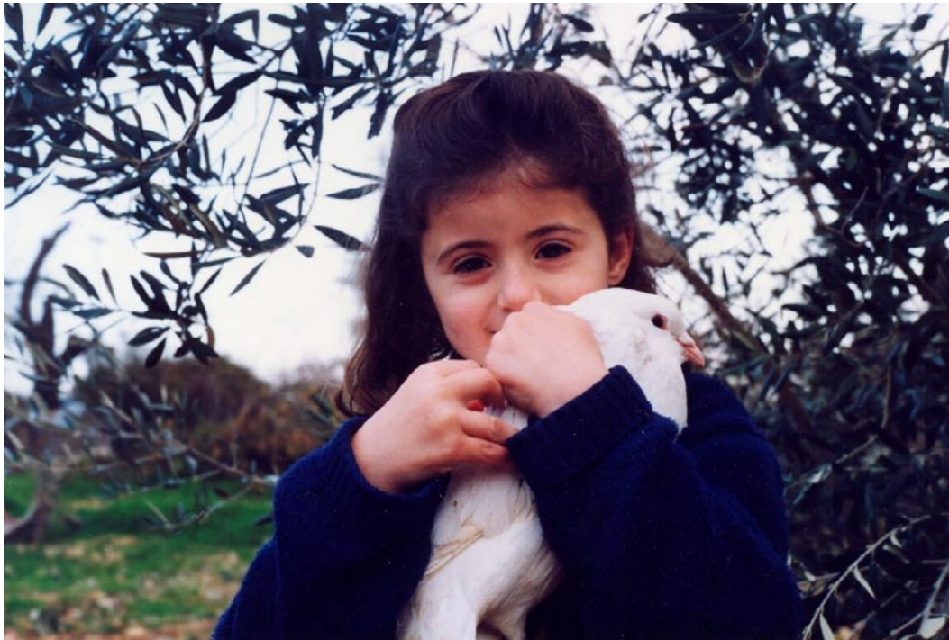
Frid på jorden och människorna en god vilja.