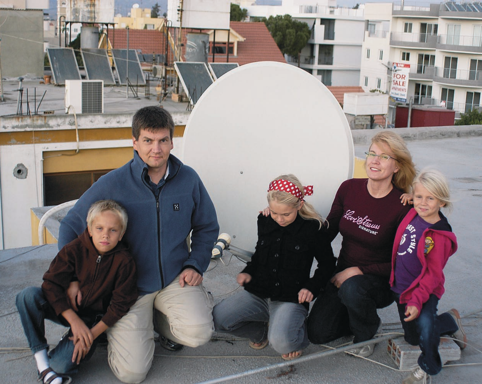
Wikströms på taket. Satellitantennerna tar in TV-sändningar i Mellanöstern.