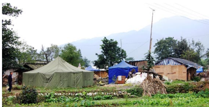
I Mianzhu-området sjunker temperaturen på vintern till några köldgrader. I byn Woyun bor man i tält eller i delvis raserade hus med tälttak.