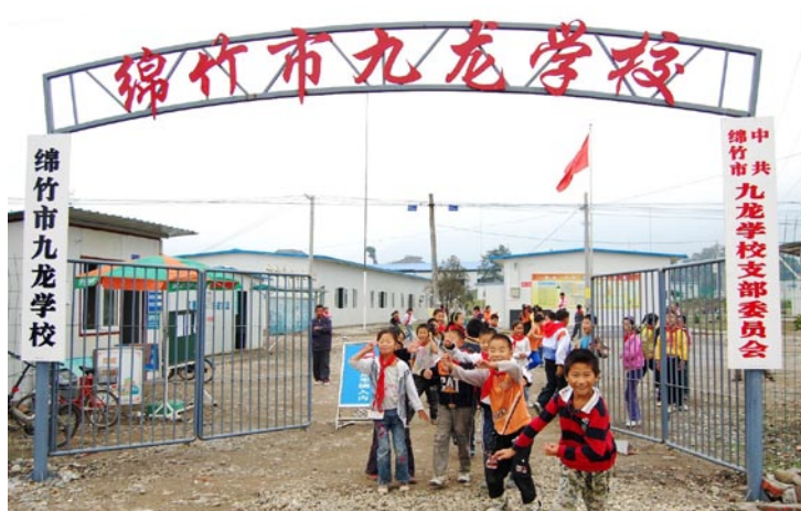
Jiulongsskolan och daghemmet verkar i provisoriska utrymmen. Skolåret började tidigare än vanligt, för de sista veckorna av föregående termin kunde man inte gå i skola på grund av jordbävningen.