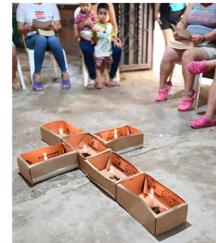
Långfredag vid missionspunkten La Gracia i Bucaramanga. Församlingsmedlemmarna funderade på Jesu sista ord på korset.