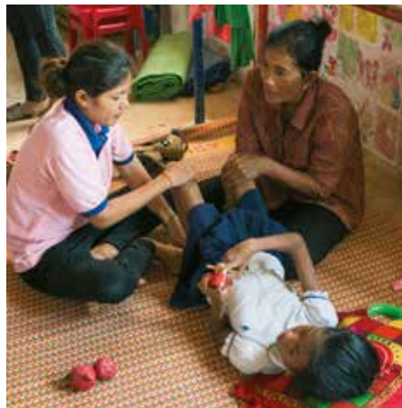
Skolan håller tät kontakt med barnens familjer. För dem är varje framsteg ett stort glädjeämne.