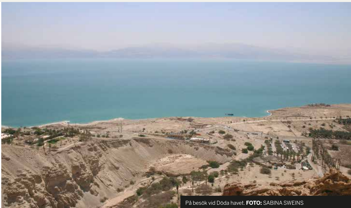
På besök vid Döda havet.

religionslärare vid Botby grundskola i Helsingfors, utsänd på praktik med Finska Missionssällskapet i Israel våren 2018.