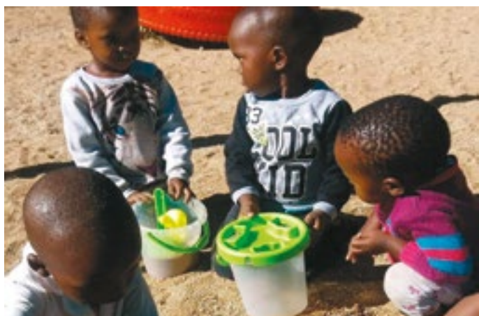
Lek i sandlådan vid kyrkans daghem.