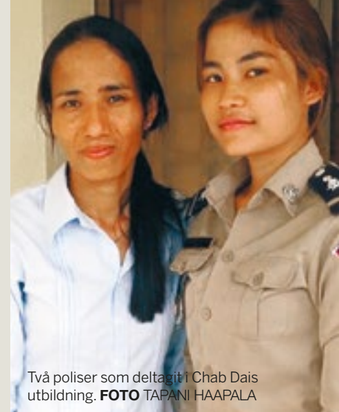
Två poliser som deltagit i Chab Dais utbildning.

Cirka en tredjedel av dem som får hjälp via Chab Dai har råkat ut för tvångsäktenskap, en tredjedel har drabbats av våldtäkt och resten är offer för människohandel.