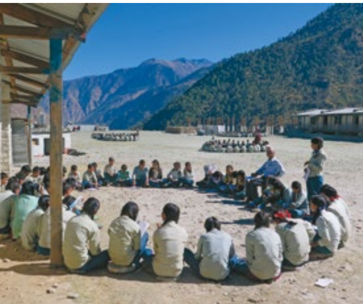
Morgonundervisning ute på skolgården.

Morgonen är sval i bergsområdet Mugu i Nepal. Skolbyggnaden i Mahakali saknar fönsterglas och klassrummen är rätt så kalla. Förmiddagens lektioner hålls därför utomhus i det varma solskenet.