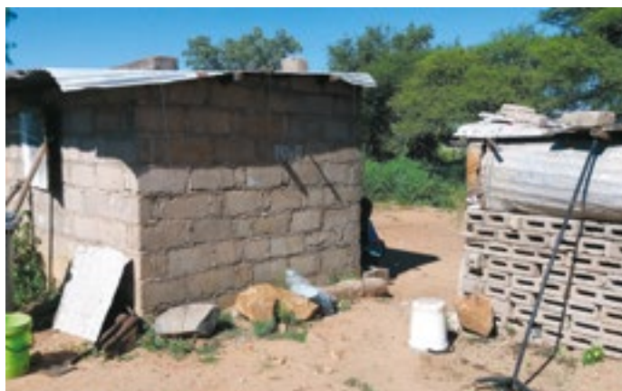
De fattigaste hemmen rymmer inga möbler.