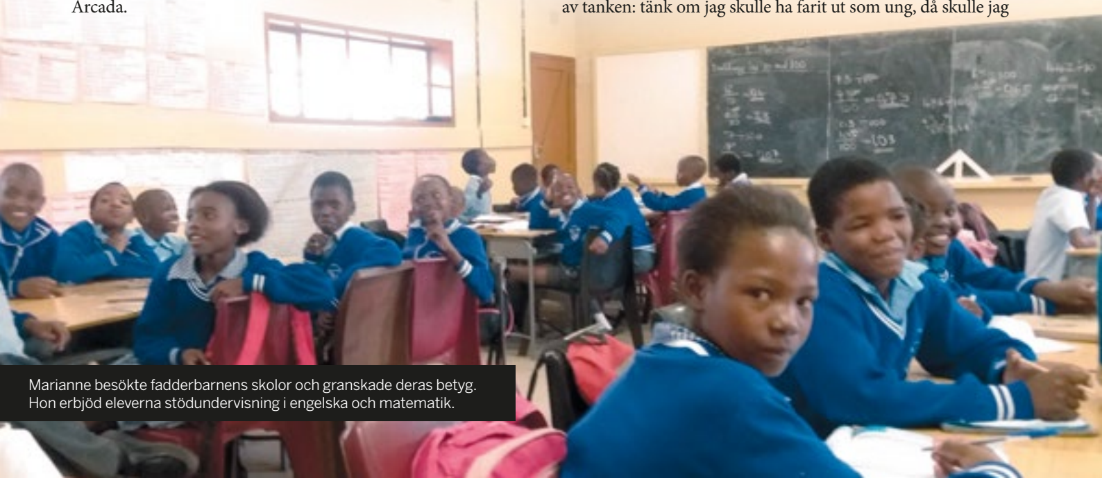
Marianne besökte fadderbarnens skolor och granskade deras betyg. Hon erbjöd eleverna stödundervisning i engelska och matematik.

– Jag trivdes så bra, vaknade full av energi varje dag. Jag slogs av tanken: tänk om jag skulle ha farit ut som ung, då skulle jag