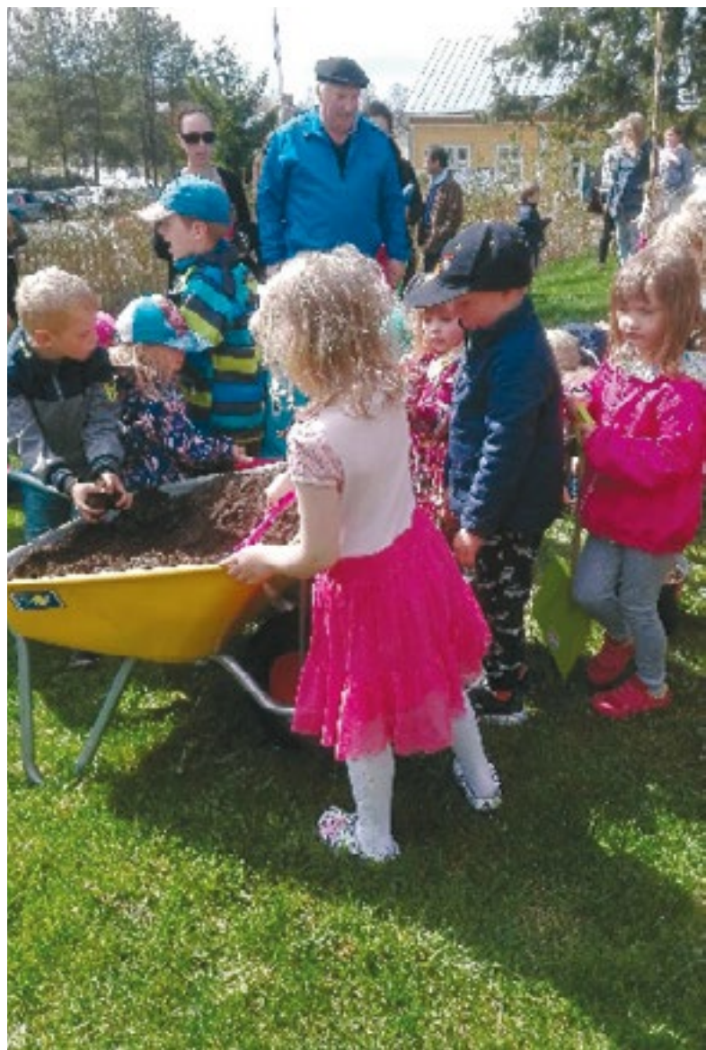
Trädplantering i Solf.