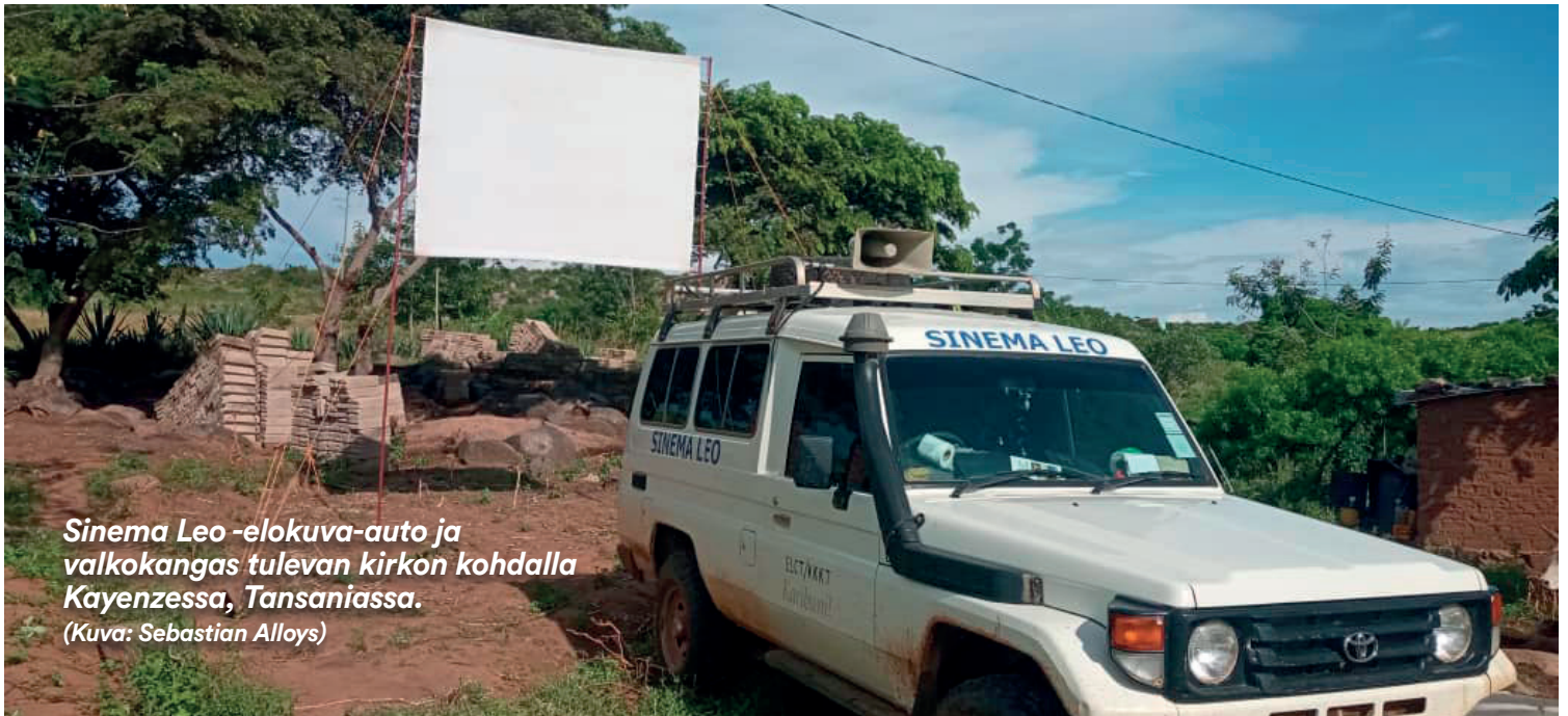
Sinema Leo -elokuva-auto ja valkokangas tulevan kirkon kohdalla Kayenzessa, Tansaniassa.