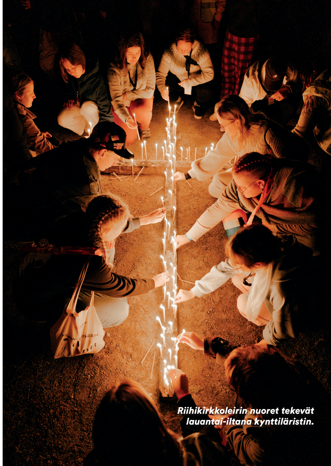
Riihikirkkoleirin nuoret tekevät lauantai-iltana kynttiläristin.

Kaikessa työssämme etsimme resurssitehokkaita, vaikuttavia ratkaisuja, edistämme vertaisoppimista ja hyödynnämme digitaalisuuden antamia mahdollisuuksia.