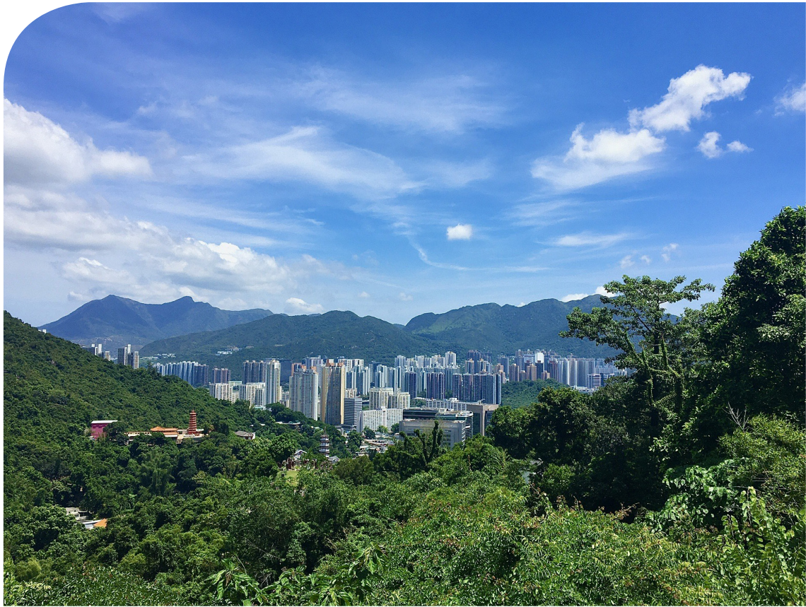
2. Maisema teologisen seminaarin pihalta HK, Harri Koskela 2022