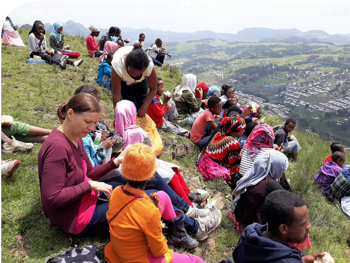
2. Tosa Mountain, Kari Pentikäinen 2018