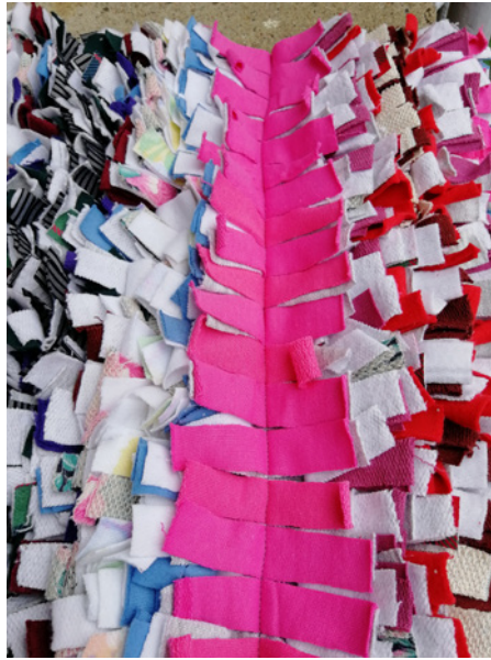
Tilkkujono ommellaan keskeltä