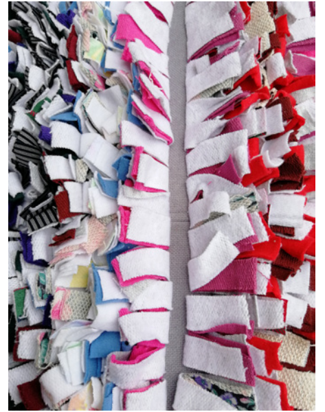
Jätä tilkkujonoihin 1,5 cm välit