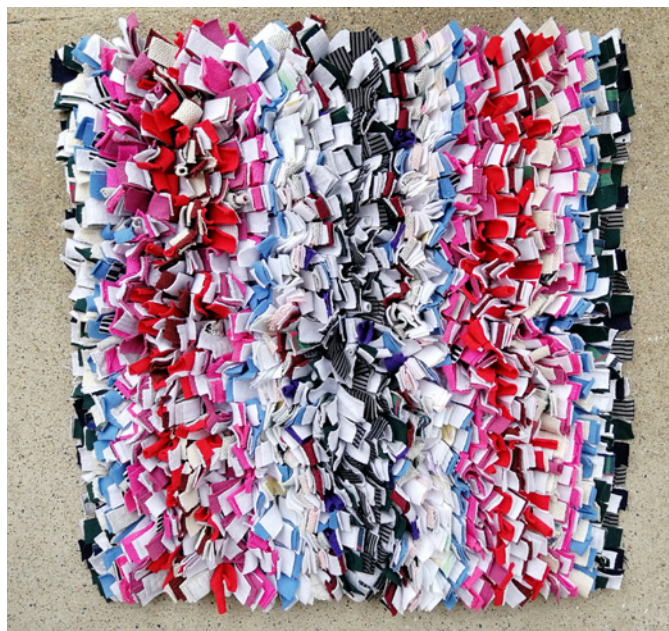
Katso video: suomenlahetysseura.fi/materiaalit